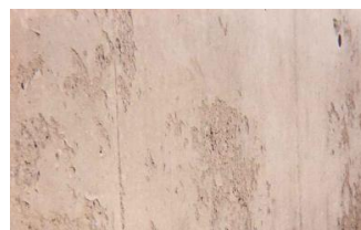
Manque d'huile de démoulage (à gauche arrachage à cause d'un manque d'huile, à droite excès d'huile)