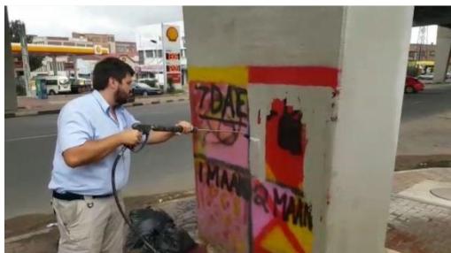
Nettoyage avec de l'eau basse pression (80bar), anti-graffiti sacrificiel

Les points ci-dessous ne sont que des points clés sur lesquels l'attention doit être attirée.