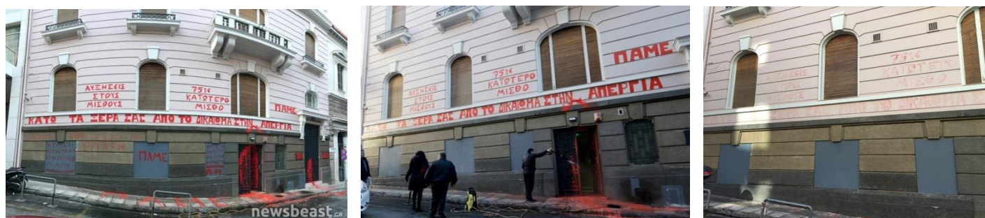
Zone protégée (soubassement) avec anti-graffiti (bien nettoyée), partie supérieure non protégée ("spectres apparents")