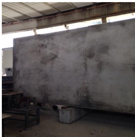
Taches laissées par l'huile de démoulage appliquée en excès sur le coffrage