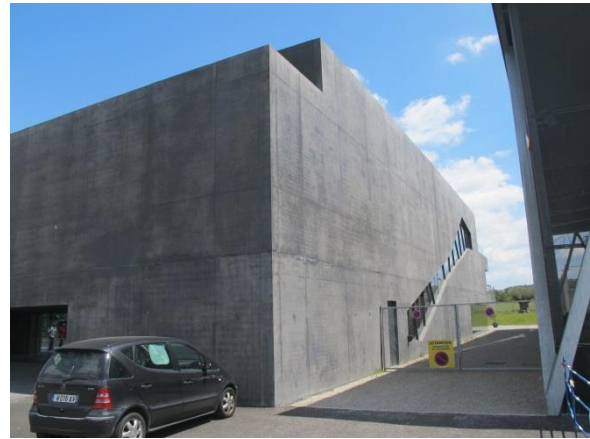
Deux exemples de bétons teintés dans la masse apparents avec des types de protections différentes