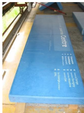
Éléments en béton bleu teintés par lasure et protégées avec anti-graffiti permanent