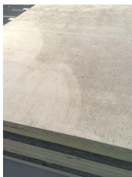
Farinage dû à un excès d'huile