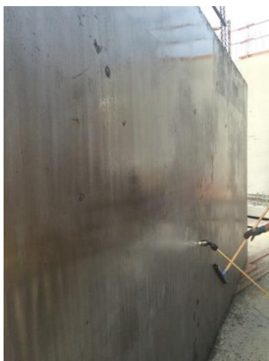
Bonne préparation de la banche avant application de la protection