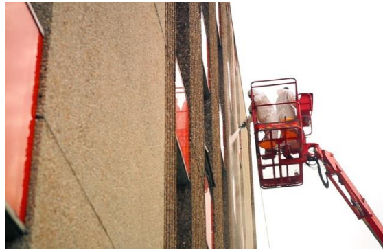
Hydrofuge en crème appliqué au rouleau / hydrofuge crème appliqué avec la pulvérisation airless