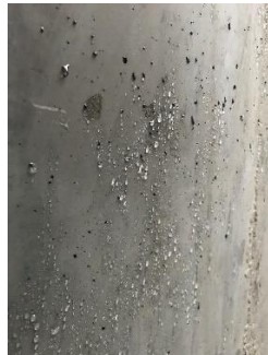
Hydrofuge de surface sur béton brut teinté dans la masse