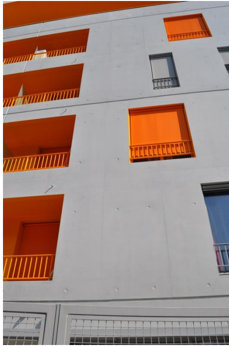
Lasure transparente laissant l'apparence de la peau du béton