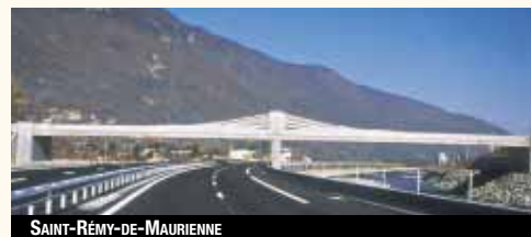
SAINT-RÉMY-DE-AURIEU – ARCHITECTE : CHARLES LAVIGNE