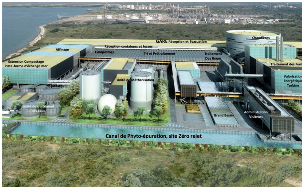
→ Schéma d'une usine idéale de traitement multifilière de déchets ménagers © S'Pace.

Avec plus de 200 projets d'usines dans le monde, votre agence s'est spécialisée dans la conception HQE® des installations industrielles.