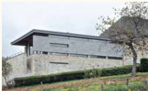
MUSÉE DE LA CIVILISATION CELTIQUE – MONT-BEUVRAY