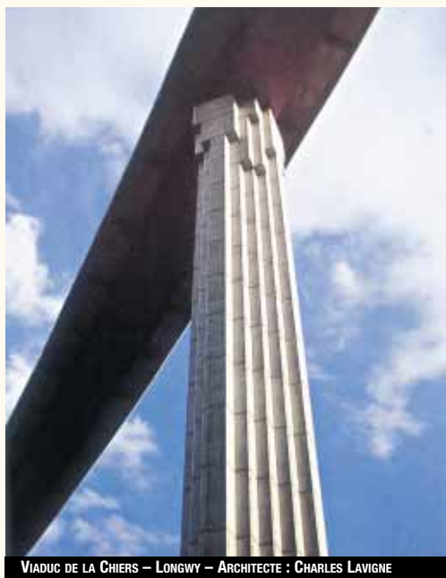
VIADUC DE LA CHIERS – LONGWY – ARCHITECTE : CHARLES LAVIGNE