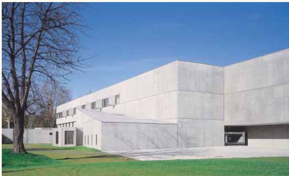
>>> Collège Pasteur à Strasbourg, D. Coulon architecte (photo : H. Abbadie).