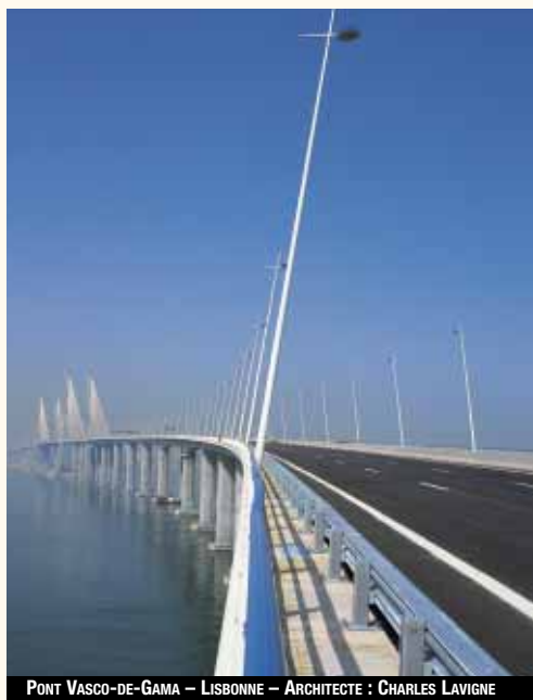
PONT VASCO-DE-GAMA – LISBONNE – ARCHITECTE : CHARLES LAVIGNE