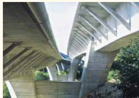
VIADUC de ROGERVILLE – A29 – ARCHITECTES : FRESSYNET ET LACROIX