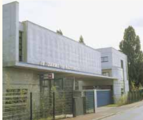
GENDARMERIE – TREMBLAY-EN-FRANCE