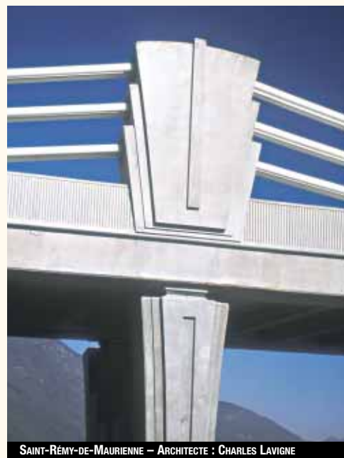
SAINT-RÉMY-DE-MAURIENNE – ARCHITECTE : CHARLES LAVIGNE