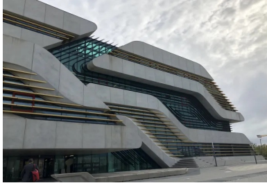
Pierre Vives, Montpellier (Zaha Hadid arch.)