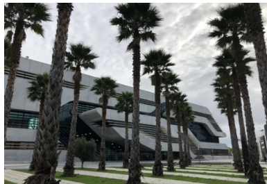
Pierre Vives (Zaha Hadid arch.)

Rencontre CINOV. L'innovation du label E+C- dans l'éco-construction. Le béton, contradiction ou opportunités RDV : Lundi 5 novembre 2018 de 14h30 à 18h30. Pierrevives, 907 rue du Professeur Blayac. 34 000 Montpellier