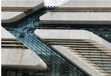
Pierre Vives. Montpellier (Zaha Hadid arch.)