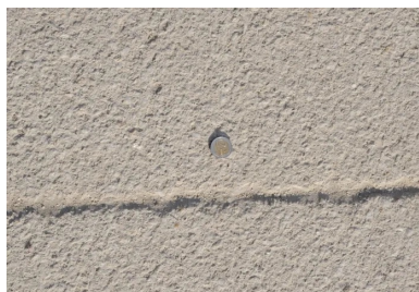
Le revêtement du parvis a été réalisé en Artificio® Bouchardé

Au total, un volume de 350 m 3 a été mis en œuvre. Commencés en mai, les allées piétonnes et le parvis ont été achevés en juin 2017.