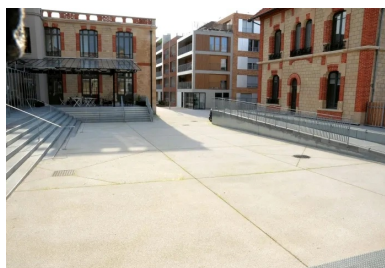
Le revêtement du parvis a été réalisé en Artificio® Bouchardé (PSP 350 kg CE2,5 N CE CP1 NF D10 S3).

Entamés au mois de mars 2016, les travaux d'aménagement du château se sont achevés en juin 2017, de sorte à permettre l'ouverture du nouvel espace en septembre. Menée en parallèle et dans le même temps par la ville de Nanterre, l'opération d'aménagement des environs de l'usine du D r Pierre s'est également achevée. Elle a permis la construction d'un ensemble de bureaux, d'un parking et de logements en accession à la propriété.