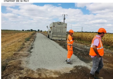
chantier de la RD7