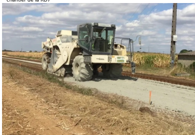
chantier de la RD7