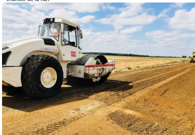
chantier de la RD7

Les journées techniques "Valorisation des matériaux en place aux liants hydrauliques" s'adressent à tous les acteurs concernés par la construction et l'entretien des routes : les élus et leurs services techniques, les bureaux d'études et tous les professionnels de la route.