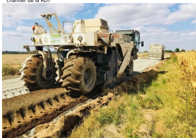
chantier de la RD7