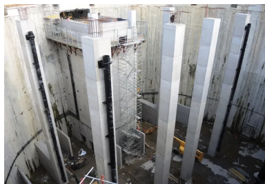
Deux des files de poteaux à l'intérieur du bassin de stockage.

Le deuxième lit a été retiré après la réalisation du radier et le premier après celle de la dalle intermédiaire. De ce fait, l'ensemble des voiles et des appuis constitutifs des différentes structures de l'ouvrage a dû être coulé en présence des deux lits de butons, ce qui a singulièrement compliqué les travaux en raison de l'exiguïté du chantier.