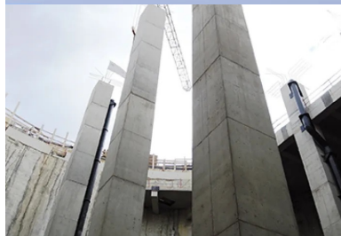
Les poteaux de 25 m de hauteur à l'intérieur du bassin de stockage.