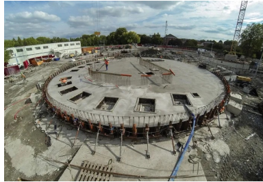
La dalle de couverture de la station.

Pour éviter les débordements dans le milieu naturel, Lille Métropole a engagé d'importants travaux pour augmenter ses capacités de stockage et de pompage. L'objectif est d'améliorer le transfert des eaux usées et pluviales vers la station d'épuration de Marquette-lez-Lille.