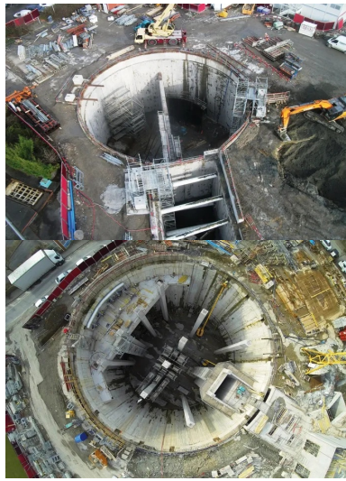
La station de pompage avec la bache de réception en partie centrale.