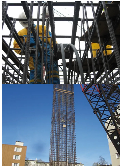
Chantier de la ligne b du métro de rennes - intégration des tuyaux géothermiques : dans les péroirs, puis reliés à une pompe à chaleur

L'objectif ? Optimiser techniquement et économiquement ces procédés en les couplant avec des panneaux solaires hybrides. Les données recueillies permettront de caler des modèles de simulations numériques de dimensionnement et de comportement des géostructures et des combinaisons de systèmes énergétiques. Ces modèles seront ensuite intégrés dans des outils spécifiques pour développer des bâtiments BEPOS.