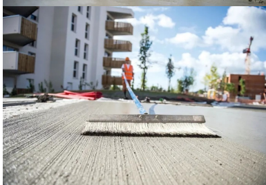
La surface du béton a enfin été animée par de fines stries régulières, réalisées au moyen d'un balai de marquage.