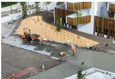
Acheminé sur le chantier par dumper, le béton a d'abord été tiré à la règle.

Pour l'heure, une seule voie dessert cette zone (l'allée de Francs), mais l'accessibilité des transports en commun ainsi que la présence de commerces de proximité sont prévues. Situées à proximité immédiate de la mairie de Bègles, de la future ligne C du tramway (en 2017) et du bus, à quinze minutes de l'aéroport de Bordeaux-Mérignac, les Sècheries sont appelées à devenir un « cœur de ville » dynamique , directement connecté à l'agglomération bordelaise. Un troisième quartier béglais, celui du XX e siècle, qui s'ajoute aux deux anciens « villages urbains », Terres-Neuves et Terre Sud.