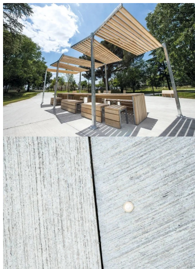
Les « stations vertes » des Sècheries : des aires de repos ou d'animation, dotées de mobilier et desservies par les cheminements en béton balayé.