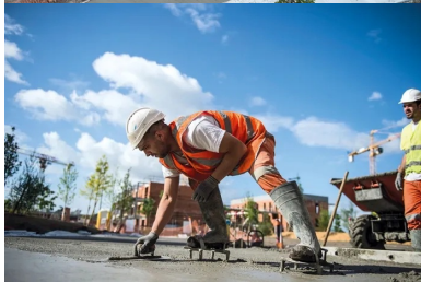
Après serrage, le béton frais a ensuite été finement taloché par des équipiers montés sur des chaussures à clous.