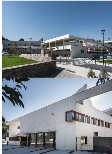
Angle sud-est, la salle de sport dispose d'une entrée en relation directe avec la rue, côté sud, afin de pouvoir servir aussi indépendamment de l'école.

Pour respecter cet objectif, le plan d'urbanisme dessiné par l'agence Ellipse, associée à l'atelier de paysage Jacqueline Osty, s'appuie sur ces lignes fluctuantes dessinées par les haies, préserve les zones humides et met en place un réseau de récupération des eaux de pluie à ciel ouvert. La place réservée à la circulation automobile est réduite au profit d'une trame verte et de cheminements piétons et cyclistes. Les immeubles résidentiels et de bureaux s'organisent en plot ou plot allongé, atteignant désormais jusqu'à neuf étages ; la densité a dû être augmentée pour répondre à l'arrivée de nouvelles populations.