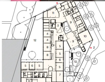
Plan de rez-de-chaussée: 1. Entrée principale 2. Accès salle de sport 3. Hall 4. Centre de loisirs 5. Classes maternelles 6. Ateliers 7. Salle de motricité 8. Salles de repos 9. Salles à manger 10. Salle de sport 11. Bibliothèque 12. Cour maternelle 13. Jardin