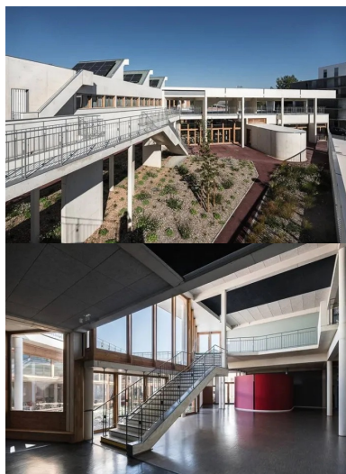
Le jardin met à distance la voie publique des salles de cours, le volume ovoïde en avant de la façade sud délimite l'entrée particulière de la salle de sport.

Les menuiseries en bois de la façade vitrée du rez-de-chaussée, placée en retrait , révèlent par effet de contraste le béton clair de la façade en drapeau. Puis, la cour des classes maternelles le long de la façade ouest est visible à travers la grille. De ce côté, la parcelle est bordée par un talus.