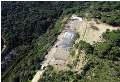
La toiture en partie végétalisée avec des espèces locales, complète l'intégration.

Par ailleurs, pour des raisons d'accès (la route est très étroite), tous les panneaux préfabriqués du « sarcophage » ont été coulés sur le chantier.