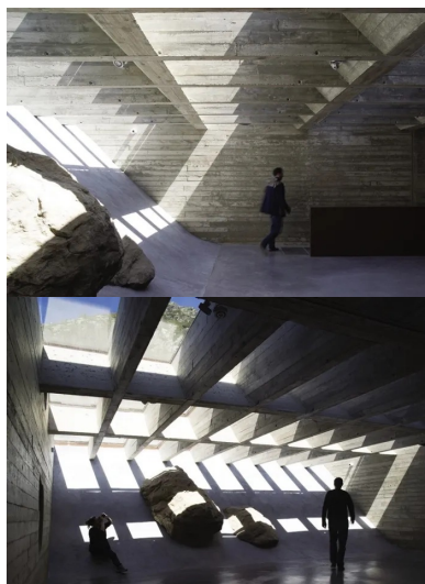
Les murs de la nouvelle salle d'exposition sont en béton coulé dans des coques en planchettes de châtaignier brossé.

« S'il n'était pas toujours flatteur avec son désordre joyeux et ses stands bricolés, le site des sources de la Loire possédait pourtant un charme désuet qui rappelle l'épopée du Tour de France ou les vacances en 4 chevaux, à une époque où le tourisme n'était pas encore une affaire de masse, il était populaire, simple, honnête. C'est ce sentiment qui nous a touchés et sur lequel nous avons fondé notre réflexion. Nous avons laissé de côté l'idée d'un aménagement trop policé comme on en voit dans tant de lieux touristiques et qui finit par les faire tous se ressembler. Notre projet s'est attaché à retrouver le vide et la minéralité que l'on peut voir sur les anciennes cartes postales. Dans le concours, il était demandé de conserver et de redonner son aspect d'origine au chalet du Touring Club de France, tout en le transformant en un petit musée d'interprétation du site pour y parler de la Loire, du volcanisme et accueillir aussi un relais touristique d'informations. »