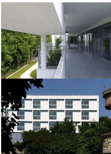
Les jardins suspendus ménagent des espaces spécifiques, créent des perspectives et offrent un morceau de nature aux résidents.