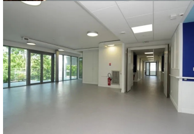
Les vastes espaces de vie permettent une aisance de circulation aux résidents en fauteuils.