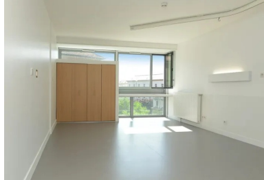
Les chambres de 28 m2 sont lumineuses et conçues dans un souci de confort maximum.