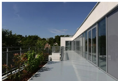
Au dernier étage, les salles d'activités sont dotées de vastes baies vitrées ouvertes sur le paysage.

Ces jardins suspendus sont conçus en quinconce de façon à créer des points de vue et des perspectives variés grâce à un jeu d'éléments architecturaux – les piliers de la structure, des voiles verticaux, les jardinières, les garde-corps. Le lien visuel permanent, sur un même niveau, mais également d'un étage à l'autre permet aux uns et aux autres de se rencontrer sans être obligés de monter ou de descendre. Les dalles des terrasses sont construites dans la continuité des dalles intérieures, avec juste un seuil de 2 cm de hauteur qui n'empêche pas le passage des fauteuils. La ventilation naturelle du bâtiment, sa double orientation est/ouest et son inertie créent un confort d'hiver comme d'été ; le bâtiment est certifié Cerqual, H&E, BBC Effinergie 2005. Les matériaux (béton, menuiseries alu, verre, émailithe) et les teintes limitées (gris, blanc, noir), l'écriture architecturale sans ostentation et la conception simple mais soignée dans le moindre détail apportent aux habitants un sentiment de considération et de prise en compte de leur situation difficile.