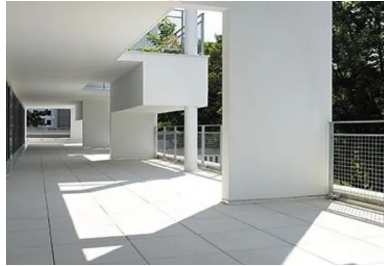
Les voiles verticaux, les poteaux et les jardinières confèrent à chaque terrasse sa singularité.