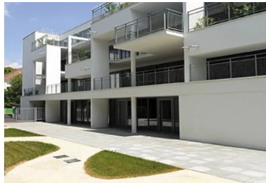
Les éléments de la structure béton sculptent la façade ouest.

avons donc aménagé de grandes terrasses et construit de très grands bacs dans lesquels sont plantés des framboisiers, des cerisiers, des groseilliers... », explique Jérôme Chiarodo.