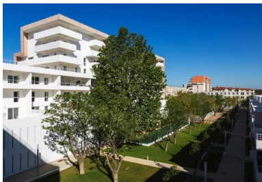
Marqué par un béton teinté le long du boulevard, le bâti est caractérisé par sa blancheur sur le cœur d’îlot.

À Marseille, le long du très passant boulevard Schloesing, à proximité immédiate du Vélodrome, cette nouvelle opération de logements s’inscrit dans le dispositif de reconstitution urbaine et architecturale du patrimoine de la SNI. Le groupe SNI, société nationale immobilière, filiale de la Caisse des dépôts et consignations, gère aujourd’hui 275 000 logements sur l’ensemble du territoire français, parmi lesquels ceux réservés aux militaires. C’est le cas de la présente opération qui jouxte des terrains de l’armée de terre à l’est et devra notamment permettre d’accueillir les soldats qui y sont mobilisés et leur famille.