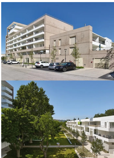
Le long de l’avenue des tirailleurs, le bâti marque un épannelage dégressif passant du r+8 au r+2.

L’ensemble s’implante en trois corps de bâti qui bordent les limites du site en marquant un épannelage d’ouest en est, du boulevard vers les terrains militaires. La composition générale forme une équerre bâtie le long du boulevard Schloesing et de l’avenue des Tirailleurs au sud, alors que le troisième corps est constitué d’un linéaire poreux de petits plots en R+2. Si la volumétrie est simple, la qualité architecturale et urbaine a permis d’offrir une grande diversité dans la façon d’accéder jusqu’à son logement.