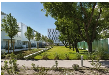
Le cœur d’îlot est remarquable par la conservation des arbres majestueux existants : platanes et alignements d’acacias.

Enfin, la limite parcellaire partagée avec les terrains militaires est constituée de logements intermédiaires en R+2 qui composent un ensemble plus domestique et préservent également les vues vers le grand paysage que compose la chaîne Saint-Cyr. Le principe de desserte à ciel ouvert permet de privatiser les accès aux habitations et de préserver des transparences vers le cœur d’îlot.