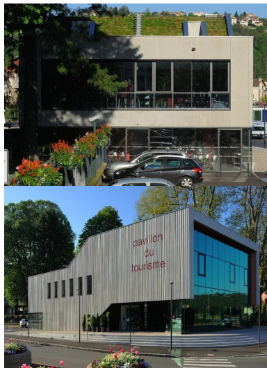
La toiture végétalisée se confond avec le paysage lointain.

Chaque année, un très grand nombre de visiteurs viennent découvrir la ville et ses alentours. Le nouveau pavillon du tourisme de Vienne et du Pays Viennois a pour vocation de les accueillir et de les informer tout en étant la vitrine de la ville et du territoire. Il se dresse au bord du Rhône à l'angle nord-ouest du parc du 8 mai 1945. Il est sculpté par son enveloppe en béton gris clair matricé, laissé brut de décoffrage , qui se découpe sur la végétation du parc. Sa matière et la vibration de sa texture animent la peau du bâtiment et accompagnent le porte-à-faux de l'étage, tendu vers le Rhône. Sur la façade nord, les lettres de l'enseigne « pavillon du tourisme » s'impriment en creux dans le béton. Enchâssées dans l'enveloppe minérale, trois parois en verre habillent la façade nord et les côtés ouverts sous le porte-à-faux. Le pavillon du tourisme offre ainsi à ses visiteurs un vaste linéaire vitré, ouvert sur l'espace urbain et sur le Rhône. « Par sa forme et son esprit, notre projet évoque un pavillon, soulevé du sol, qui expose sa terre, son terroir, ses racines, ses ressources et ses plaisirs. Au sens architectural, ce pavillon a la force d'une " folie ", objet inattendu, signal visible de toute part, qui interroge, suscite l'intérêt et la visite. Au sens imagé, ce pavillon est la chambre d'écho de l'office du tourisme, à l'écoute et au service des acteurs de son territoire », expliquent les architectes.