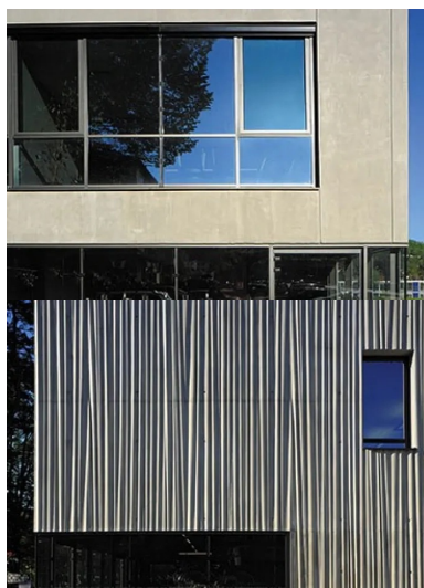
Le service de location de vélos, installé au rez-de-chaussée de la façade est, met les vélos en vitrine et incite à leur usage.

Le bâtiment, isolé par l'intérieur, répond aux exigences de la RT 2012. Un vide entre les éléments verticaux et horizontaux en béton est rempli avec l'isolant et assure la rupture de pont thermique. Seules les connexions nécessaires à la stabilité structurelle sont conservées.