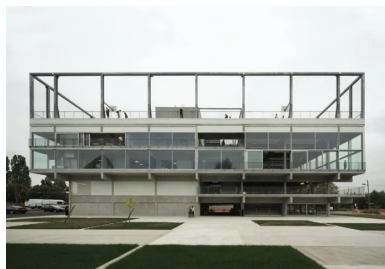
Pas de hiérarchisation des façades qui sont traitées selon le même principe.