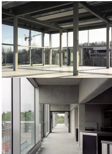
La salle du restaurant universitaire, très ouverte, s'élève sur un double niveau.

Là, l'isolant est posé au-dessus de la dalle, ce qui évite les ponts thermiques avec les parties vitrées. De plus, toutes les baies de la façade sud sont ouvrantes alors qu'elles ne le sont pas au nord. En revanche, celles-ci sont équipées de stores pour éviter la sensation de froid. « Pour cet équipement, nous n'avons pas eu une démarche classique. Étant donné les contraintes d'occupation, nous avons conçu un bâtiment réactif, car il n'est pas utilisé de façon permanente », conclut l'architecte.