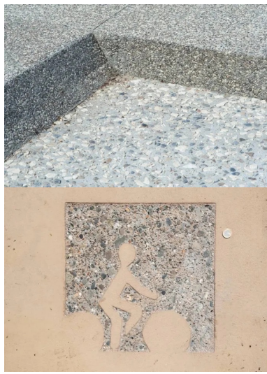
Des bordures inclinées pour une transition douce entre trottoirs et voirie.