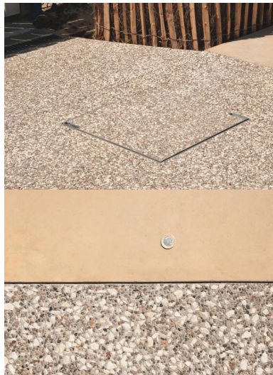
Sur les jardinières, de petites ganivelles rappellent les « barrières girondines » qui servent de coupe-vent sur les dunes.