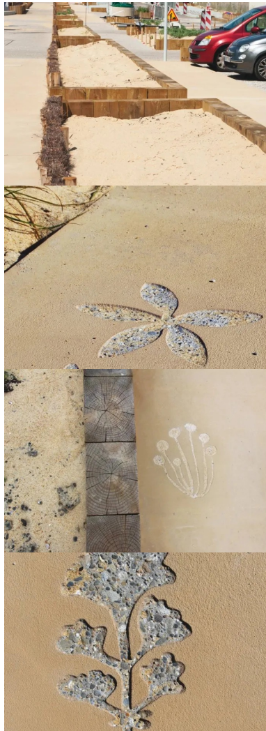
Un béton faiblement désactivé a été mis en œuvre, notamment sur la place des Basques.

À chantier exceptionnel, mobilisation exceptionnelle. Chez Sols-Aquitaine, le renfort de Sols-Vallée du Rhône a permis de maintenir « treize personnes en permanence sur le chantier », au plus gros de l'activité. En juin 2016, la renaissance est achevée, comme prévu ! Soorts-Hossegor peut de nouveau s'enorgueillir d'être « l'élégante station des sports élégants » et d'accueillir ses surfeurs dans un environnement convivial. Un chantier de référence, qui aura nécessité la mise en œuvre d'environ 1 800 m 3 de béton décoratif, au total !