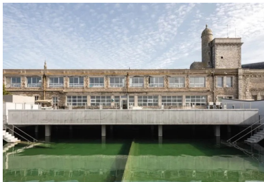
À l'avant de la façade nord, la nouvelle plateforme d'expérimentation en béton armé surplombe une partie du vivier.

À l'instar du « vivant » qu'elle étudie, la station biologique de Roscoff montre que le « construit » est également un organisme évolutif et adaptable.