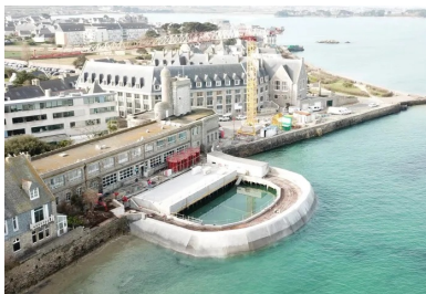
Implanté sur le front de mer, le bassin du vivier permet d'assurer la continuité des travaux de recherche quelle que soit la marée.

Au contact direct avec les éléments marins, le vivier, qui assure le stockage de l'eau à marée basse et garantit la continuité du travail de recherche, comme la passerelle circulaire qui le surmonte présentaient des signes de faiblesse. Leur rénovation a été l'occasion de modifier l'organisation des lieux en supprimant un bâtiment et en créant une plateforme qui surplombe une partie du vivier. Outre l'ajout des locaux expérimentaux, le nouvel aménagement répond aux actuels impératifs de sécurité, libérant notamment l'accès pompiers.