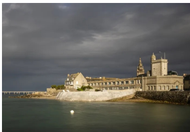
La station biologique est un élément du patrimoine architectural de Roscoff.

L'usure de la passerelle s'apparentait à la pathologie des bétons maigres. Elle a été déposée puis reconstruite à l'identique en conservant les mêmes points d'appui et le même radier. « Elle se compose d'un béton architectonique autoplaçant de teinte grise, avec des banches sur mesure conformes à la trame constructive, reprend Christophe Wilke. Nous avons calepiné les trous de banches pour les rendre invisibles de manière à souligner le caractère ancien et brutaliste du mur-poids. »