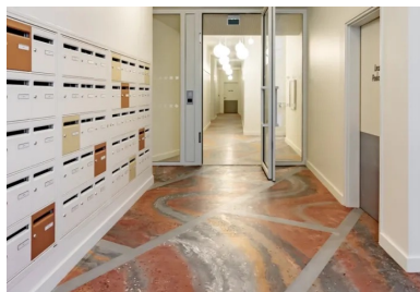
Dans les halls partiellement surélevés, le « Marbre de Fulton ».

Les deux halls lumineux à la volumétrie généreuse qui desservent les deux têtes de pont de l'opération s'immiscent dans la profondeur de l'îlot. En réponse au plan de prévention des risques d'inondation (PPRI), ils sont légèrement surélevés par rapport à la rue. Ouverts vers le jardin, ils contribuent d'autant plus à l'agrément du cadre de vie des habitants que leur sol est paré du « Marbre de Fulton », une sculpture horizontale du plasticien Stefan Shankland. Cette œuvre d'art intégrée d'emblée à l'architecture est née d'une demande de la maîtrise d'ouvrage ICF Habitat La Sablière. Cette dernière tenait à garder au sein de cet îlot la mémoire des anciens bâtiments de la « cité Fulton » démolis, construits par l'architecte Daniel Michelin dans les années 1950. Le Marbre de Fulton reprend en les adaptant les principes du « Marbre d'ici ». Ce protocole artistique développé par Stefan Shankland au début des années 2010 permet de produire un béton de site ornemental en recyclant les gravats de démolitions d'immeubles, triés par nature et par couleur, concassés et tamisés. Mélangés à un liant hydraulique et à de l'eau, malaxés et coulés en strates ou en marbrures, ces déchets de chantier sont transformés en un nouveau matériau à haute valeur ajoutée esthétique, écologique et patrimoniale.