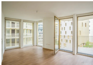
À l'intérieur de ces appartements largement vitrés, les habitants profitent de la lumière et des vues.

C'est aussi pour sa pérennité, ses performances acoustiques et sa forte inertie thermique que le béton armé s'imposait en structure. Dans ce bâtiment isolé par l'extérieur, les parois intérieures lourdes conservent la chaleur l'hiver et la fraîcheur l'été. Cette disposition règle le traitement des ponts thermiques par l'emploi associé de rupteurs au niveau des balcons. L'isolant en laine minérale, dont l'épaisseur égale celle des voiles de façade (160 mm), est recouvert selon les niveaux du bardage en terre cuite ou d'enduit. Le chauffage et l'eau chaude sanitaire sont raccordés au chauffage urbain alimenté pour moitié par des énergies renouvelables et de récupération. En complément, un système de récupération de chaleur sur les eaux usées par pompe à chaleur permet de préchauffer l'eau chaude et de réduire les besoins énergétiques. La géométrie des immeubles et leur compacité, le traitement de l'enveloppe et les procédés constructifs sont aussi un gage d'efficacité énergétique.