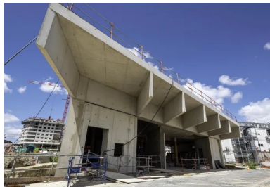
Gare de Bagneux-Lucie-Aubrac, Atelier Barani, architectes, photo : © Gérard Rollando

Pas moins de 68 gares, dont 80 % reliées à l'actuel réseau, desserviront quartiers d'affaires, pôles scientifiques, aéroports et gares TGV. Selon les projections, trois millions de personnes seront transportées, avec l'objectif de limiter la part de la voiture au profit des transports collectifs tout en améliorant la desserte régionale. Ce vaste chantier s'accompagne de 180 projets d'aménagement urbain et paysager autour des gares.