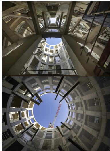
Gare de Saint-Maur-Créteil, ANMA Architectes Urbanistes

Une charte d'architecture basée sur les dimensions haptique et corporelle, la variété d'espaces et d'éclairages oriente la conception des gares. Une grande diversité d'ambiances, d'acoustiques et de matériaux accompagnent les bétons, incontournables pour ces infrastructures souterraines. Tandis que la gare d'Antony-pole-Wissous (Ateliers 2/3/4/ architectes) prend la forme d'un bâtiment biomorphe en béton de granulats clairs, celle de Bagneux-Lucie-Aubrac (atelier Barani, architectes) se rapproche d'une grotte souterraine avec son béton texturé clair. Cette ambition esthétique se traduit aussi par l'association, dans chaque gare, entre un architecte et un artiste en vue de créer des univers identifiables par les voyageurs.