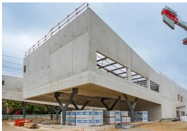
Gare d'Antony-Wissous, Ateliers 2/3/4/ architectes, photo : © Olivier Brunet

Plus qu'un projet de réseau de transport public, le Grand Paris Express accélère la mutation de l'Île-de-France. Souterraines ou en surface, les infrastructures qui l'accompagnent tirent profit des multiples avantages des bétons.