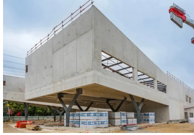
Gare d'Antony-pôle-Wissous, Ateliers 2/3/4/ architectes

Plus qu'un projet de réseau de transport public, le Grand Paris Express accélère la mutation de l'Île-de-France. Souterraines ou en surface, les infrastructures qui l'accompagnent tirent profit des multiples avantages des bétons.