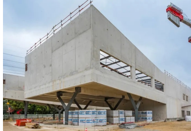
Gare d'Antony-pole-Wissous, Ateliers 2/3/4/ architectes, photo : © Olivier Brunet

Plus qu'un projet de réseau de transport public, le Grand Paris Express accélère la mutation de l'Île-de-France. Souterraines ou en surface, les infrastructures qui l'accompagnent tirent profit des multiples avantages des bétons.