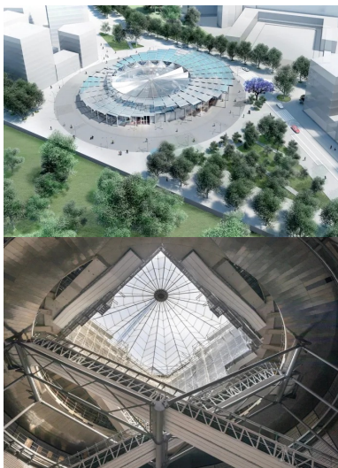
Gare de Villejuif-Institut-Gustave-Roussy, Dominique Perrault Architecture, image : © DPA, photo : © Cyrus Cornut.

Le recyclage de 80 % des déblais de chantier et leur évacuation sous terre pour limiter les rotations de poids lourds traduisent la priorité environnementale.