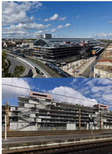
Le béton de ciment clair laissé apparent s'accorde à la pierre blonde du bâti alentour.

Avec plus de 17 millions de voyageurs par an et jusqu'à 50 mille par jour sans compter les simples visiteurs qui représentent 20 % des usagers de la gare, la gestion des flux est primordiale. Le croisement de problématiques d'accessibilité et urbaines implique un travail de requalification des espaces publics alentour.