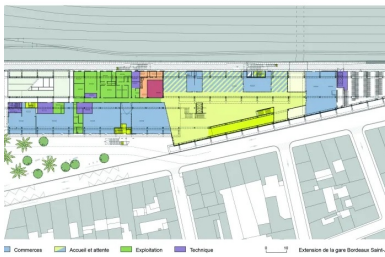
Plan de rez-de-chaussée. Hall 3 2. circulations 3. commerces 4. Accueil attente 5. Exploitation