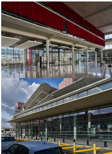
dans la continuité du hall, l'espace d'attente et d'accueil se glisse sous le premier niveau partiel de parking perceptible derrière les rideaux rouges.