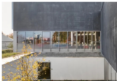
Vue de l'un des patios offerts   une extension ext rieure des activit s.

La transparence du socle et l'opacit  du b ton anthracite all gent le dessin de la fa ade principale dans une alternance du lourd et du l ger qui pond re la compacit  de l' difice dont la sym trie est rompue par un porte- -faux d'angle.