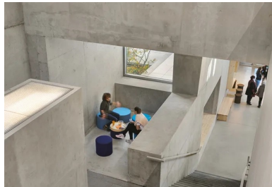
Au fil de ce parcours baign  de lumi re naturelle, des espaces sont propices   diff rentes appropriations.

Un travail en plan et en coupe orchestre des espaces dans un jeu infini de variations de surface et de hauteur, de perspectives et de boîtes à lumière qui percent la masse construite. Micro-urbanisme quasi labyrinthe, le plan révèle ainsi l'imbrication complexe des programmes et des épaisseurs qui abritent les trois entités et leurs salles de musique, d'enregistrement, de danse et d'arts plastiques, de répétition et de création. « Dans cette architecture de l'interstice et de l'anfractuosit , les parcours se croisent et s'entrelacent pour mieux dévoiler les programmes imbriqu s autour d'une agora qui articule les  l ments publics tels que le bar, l'espace d'exposition ou la salle de conf rence. Des patios et des terrasses irriguent de lumi re naturelle tous ces lieux juxtapos s les uns aux autres sans hi rarchie apparente qui rythment le parcours », ajoute l'architecte.