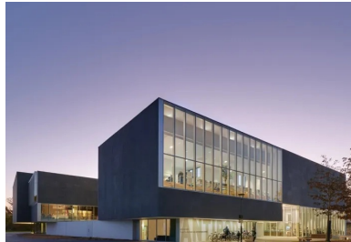
Dans son contraste avec l'opacité du béton anthracite, la blancheur du socle crée un effet de décollement ; le bâtiment semble flotter face au parc.

ZAC de La Courrouze. À la jonction des quartiers de Cleunay, La Courrouze et Arsenal-Redon à 2 km du centre historique de Rennes, un quartier neuf investit un vaste territoire qui accueillait jadis des usines d'armement.