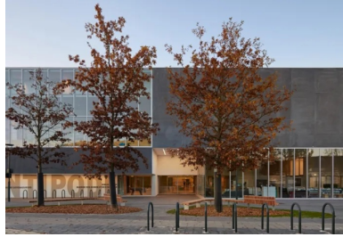
La façade principale où la masse du béton révèle le jeu des porte-à-faux et des transparences.

En connivence avec les vides, la puissance du béton de cet équipement culturel polyvalent fait la part belle à la lumière du jour qui glisse sur son épiderme.