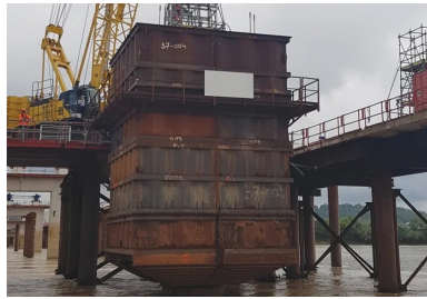
Chaque fût de pile est bétonné à l'intérieur d'un caisson étanche solidarisé au pieu de fondation, ce qui permet de limiter les affouillements.

Pour finaliser la structure de l'ouvrage restait à réaliser le hourdis béton. « Il faut s'imaginer une dalle en béton armé de 25 000 m 2 , soit l'équivalent de quatre terrains de football ! », s'enthousiasme Thomas Chavignier. Pour couvrir cette surface exceptionnelle, une méthodologie minutieusement planifiée est déployée. Le tablier a été divisé longitudinalement en deux zones principales : le tablier amont et le tablier aval. Chacune de ces zones est subdivisée en 39 plots d'environ 320 m 2 . La réalisation de chaque plot mobilise une dizaine de compagnons, impliqués dans les opérations de coffrage/décoffrage et de bétonnage.