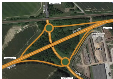
Un double carrefour giratoire au pied de l'échangeur.