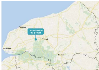
Localisation du projet.