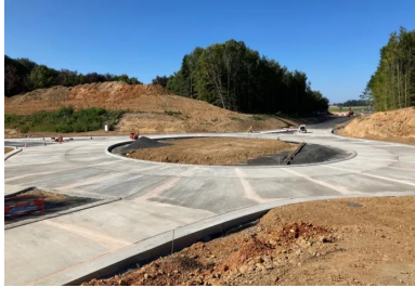
Vue du carrefour giratoire en béton en cours de finition.

Le département de la Seine-Maritime et la région Normandie viennent d'achever l'aménagement d'un carrefour giratoire au droit de l'échangeur entre la RD6015 et les RD926 et RD33, au lieu-dit du Poteau d'Allouville, sur la commune d'Allouville-Bellefosse. Cet aménagement sécurisera tous les déplacements des usagers de ce carrefour complexe et confortera la desserte du territoire.