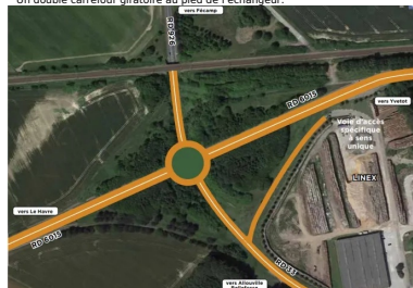
Un carrefour giratoire au droit de l'échangeur.

La comparaison des deux solutions, selon différents critères, a conduit le Département à retenir celle d'un giratoire central à l'emplacement du passage supérieur de la RD6015 sur la RD926.