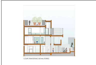
Coupe transversale sur le hall d'entrée