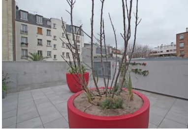
Un espace de jeux et d'activité en toiture-terrasse.