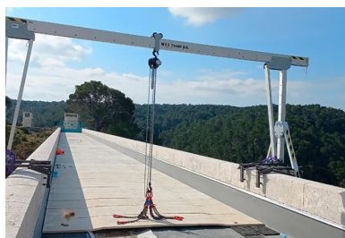
Les dalles manportables sont posées à l'aide d'un portique roulant.

Ce choix s'est montré pérenne pendant plus de 160 ans. Mais en 2007, la SNCF signale des chutes de pierres. « Le colosse souffrait de dégradations naturelles avec des infiltrations dans les pierres, les tabliers et les joints », explique Laurent Deloince. « La Métropole a donc inscrit sa rénovation dans le cadre du schéma directeur du patrimoine à entretenir, ainsi que dans le programme pluriannuel d'investissement. Des travaux prioritaires ont commencé dès 2008 avec des cordistes qui ont effectué des opérations de purge au niveau des arches qui enjambent la voie SNCF et la RD 65. » Depuis juin 2020, l'ouvrage fait l'objet d'une rénovation globale qui durera jusqu'en janvier 2024 (44 mois) sans interrompre l'activité de l'aqueduc. Les enjeux sont de plusieurs ordres : permettre le bon fonctionnement du transport de l'eau (180 millions de mètres cubes par an) vers un bassin de population avoisinant les 1 200 000 usagers, restaurer un patrimoine dégradé et sécuriser les voies de circulation qu'il franchit. Pour ce faire, la Métropole, dont l'une des missions consiste à délivrer une eau saine à la consommation, a enclenché les études préalables et a désigné l'architecte du patrimoine François Botton lors de la consultation en 2014.