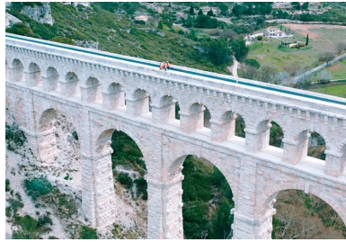
Construit en 1834, cet édifice patrimonial est aujourd'hui l'un des derniers aqueducs en activité.

Le tablier supérieur de cet ouvrage classé monument historique alimente en eau la métropole marseillaise. Il est dorénavant protégé par une couverture en BFUP.