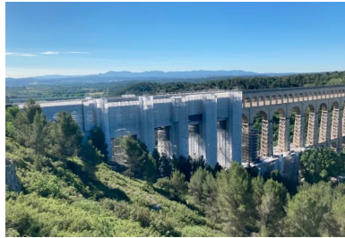
Les travaux portent notamment sur le remplacement des pierres et la réfection de l'étanchéité sur les trois tabliers.

Il s'agit du plus haut aqueduc en pierres de taille du monde. Culminant à 83 m de hauteur, ce joyau du patrimoine provençal (375 m de long) enjambe la vallée de l'Arc, une voie ferrée et une route départementale pour acheminer l'eau de la Durance jusqu'à l'agglomération marseillaise via le canal de Marseille.