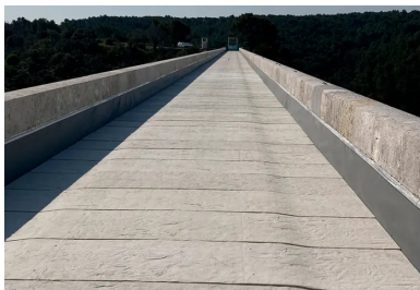
Épaisses de 3 cm, les dalles servent également d'espace de circulation pour les engins lors des visites d'entretien.

Pour le tablier supérieur, les enjeux sont différents : il accueille la conduite d'eau et il est beaucoup plus exposé aux intempéries. Ouvert à l'origine, busé dans les années 1970 pour éviter tout contact entre l'eau et la maçonnerie, il a ensuite été étanchéifié avec une géomembrane et des dallettes en béton . Le tout avait souffert et il était indispensable d'optimiser durablement l'étanchéité pour améliorer la maintenance. C'est pourquoi François Botton a préféré au béton armé un béton ultra-hautes performances ( BFUP ). Quatre cent soixante-dix dalles en BFUP Smart-Up [Structure +] blanc recouvrent ainsi le tablier supérieur, servant à la fois de lest pour la géomembrane de protection et d'espace de circulation pour les engins lors des visites d'entretien. Légèrement galbées, rigidifiées par deux nervures, les dalles ne mesurent que 3 cm d'épaisseur pour être manposables. « Outre la mise au point de spécificités techniques très précises, nous accompagnons le préfabricant et l'entreprise, en l'occurrence Innobéton et NGE GC PACA, dans la conception des moules et la formulation du produit le plus adapté en termes de performances mécaniques, de durabilité, d'ouvrabilité, de souplesse d'utilisation », précise Jérôme Frécon, responsable d'activité Smart-Up chez Vicat.