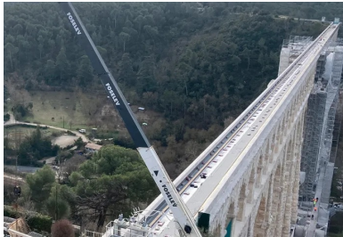
Approvisionnement des dalles sur le tablier supérieur.

« Le marché confié à NGE GC PACA consiste à restaurer les tabliers », explique Maxime Alarcon, conducteur de travaux chez NGE GC PACA. « Les tabliers intermédiaires, de petites dimensions, ont été revêtus de dalles en béton armé. »