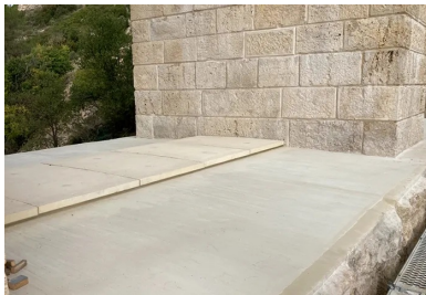
Complexe d'étanchéité sur le tablier intermédiaire.