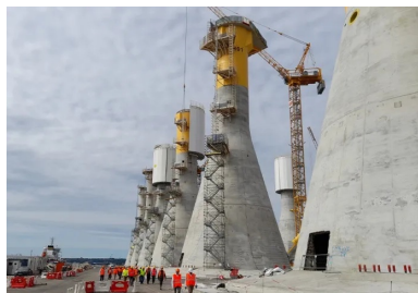
Une fois immergées, les embases en béton constitueront des récifs artificiels de tout premier choix pour le développement de la faune et de la flore marines.

La sixième étape était peut-être la plus complexe à mener à bien. À l'interface entre le sommet du fût et la base du mât métallique des éoliennes, la tête de couronnement intégrait tout à la fois les ancrages hauts des 18 câbles de précontrainte, les 24 tiges de levage hautes et les 108 tiges verticales de fixation des mâts. « Dans cette zone très dense, l'installation des tiges de fixation dans les cages d'armatures devait être réalisée au millimètre près, raison pour laquelle nous effectuons des contrôles par photogrammétrie, une technique permettant de valider précisément leur positionnement », détaille David Borel. Une fois cette délicate opération menée à bien, restait à tendre les câbles de précontrainte, à peindre en jaune - couleur conforme aux règles de signalisation - le fût sur 13,5 m de haut, à installer au niveau de la tête de couronnement les plateformes définitives de maintenance, aux planchers constitués de dalles préfabriquées en béton armé , puis enfin de finaliser la pose des structures métalliques et le câblage des équipements électriques de chaque fondation .