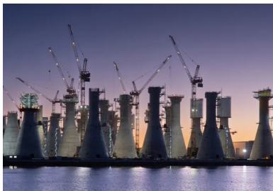
Les 71 fondations gravitaires ont été érigées en parallèle sur un quai du grand port maritime du Havre.

Pour stabiliser les 71 éoliennes du futur parc éolien en mer de Fécamp, les équipes de Bouygues Travaux Publics ont érigé des fondations gravitaires géantes de 50 m de haut.