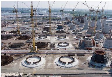
Cette usine à ciel ouvert de 27 ha comprenait quatre lignes de production.

L'élaboration de leur design précis pouvait commencer. De multiples paramètres entraient en ligne de compte : les charges de service, comme la résistance au vent et à la houle, ou la résistance à l'accostage des navires de transfert de personnel, mais aussi les charges provisoires, liées à la méthodologie d'installation et aux différentes phases de levage – levage à terre par le bas de la structure, transport sur des chariots multi-roues, et levage en mer par le haut de la structure. « La somme de ces contraintes a conduit à un design commun à toutes les fondations », synthétise Jean-Claude Gandolfini, directeur technique du projet pour le groupement. Soit une structure en béton armé de près de 5 000 t disposant d'un large fût conique en partie basse – le radier circulaire présentant un diamètre de 31 m – s'effilant progressivement pour devenir cylindrique en partie haute, la hauteur de l'ensemble s'échelonnant entre 48 et 54 m en fonction de la bathymétrie. « Le fût est renforcé par l'intermédiaire de 18 câbles de précontrainte », précise Jean-Claude Gandolfini.