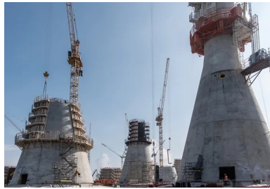
Pour optimiser leur utilisation, les coffrages étaient transférés d'une fondation à l'autre suivant une période de rotation de dix jours.

Les 122 000 m 3 de béton de structure ont été réalisés avec deux formulations se distinguant par leur classe d'exposition aux risques de corrosion par les chlorures marins. Les bétons immergés sont ainsi de classe XS2 et les bétons émergés de classe XS3. « Les essais sur maquette ont montré que les embruns pouvaient atteindre le sommet des fûts. La classe XS3 a été retenue sur toute la hauteur émergée, alors qu'elle est habituellement réservée aux zones de marnage », précise Claire Couderc. Les bétons, acheminés depuis deux centrales situées à 7 km du chantier, ont été mis en œuvre par pomp age, hormis pour les parties hautes de fût et les têtes de couronnement, coulés à la benne.