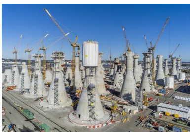
Pour optimiser le processus industriel de construction, les embases étaient réalisées en décalage de phases.