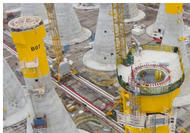
Les plateformes définitives de maintenance sont situées au niveau de la tête de couronnement des embases.

Alors que le chantier de Génie Civil s'est achevé courant de l'été 2022, les opérations d'équipement des fondations gravitaires sont en cours et le transport et l'installation en mer prendront le relais à l'été 2022. Chaque fondation sera d'abord soulevée à 1,5 m du sol par deux portiques positionnés de part et d'autre de celle-ci. Ceux-ci la déposeront délicatement sur des chariots multi-roues, qui la transporteront sur une barge spéciale postée à quai , remorquée jusqu'au site du parc éolien au large de Fécamp.