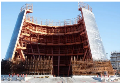
La partie conique du fût était coulée en deux levées successives de 11 m, grâce à des coffrages sur mesure.

Pour le chantier de Génie Civil – l'un des plus importants de France – Bouygues Travaux Publics a fait le choix de l'efficacité. Le grand port maritime du Havre a ainsi mis à disposition du groupement une enceinte bord à quai de 27 ha, suffisamment vaste pour pouvoir ériger toutes les fondations en parallèle. Cet atelier industriel à ciel ouvert comprenait quatre lignes de production, chacune d'elles disposant de quatre grues à tour de forte capacité à flèche relevable pour alimenter les différents postes, et de jeux complets de coffrages intérieurs et extérieurs. « Afin d'optimiser l'utilisation et la rotation des matériels, les embases étaient réalisées en décalage de phases », illustre Claire Couderc, ingénier méthodes chez Bouygues Travaux Publics. Ainsi, en février 2022, alors que le Génie Civil d'une première embase était achevé, les 70 autres étaient toujours en cours de construction, à différentes étapes de leur achèvement.