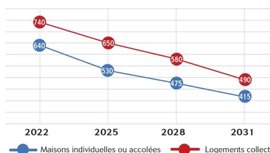
Fig. 9 Evolution des seuils de ICÉnergie