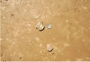
Le schiste est une roche qui a pour particularité d'avoir un aspect feuilleté, et de se déliter en plaques fines ou « feuillet rocheux ». On notera également son aspect brillant.

Les matériaux sont altérés en surface (classification GTR majoritairement B5) et de plus en plus indurés à mesure que la profondeur augmente.