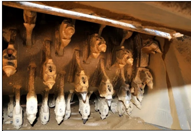
Un malaxeur Wirtgen WR 240i avec injection d'eau dans la cloche a permis le malaxage du matériau et du LHR.