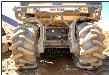
Un malaxeur Wirtgen WR 240i avec injection d'eau dans la cloche a permis le malaxage du matériau et du LHR.