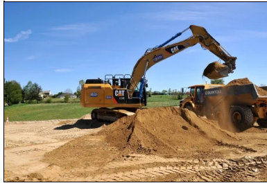
Les matériaux sont repris sur le stock à l'aide d'une pelle sur chenilles et de tombereaux articulés, puis mis en œuvre sur 40 cm par des bulis assistés par GPS.