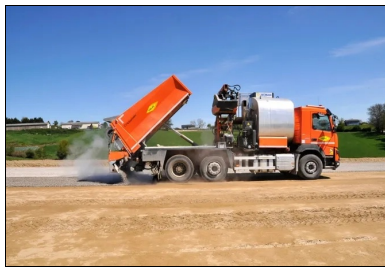
Protection de la couche de forme avec un enduit GLG.

Enfin, un enduit GLG (cloutage plus enduit monocouche) a été appliqué pour protéger la couche de forme et pour assurer la bonne prise hydraulique du mélange. À noter que la circulation des véhicules sur la couche traitée a été neutralisée pendant un délai de quatorze jours, pour ne pas rompre la prise hydraulique.