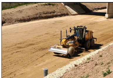
Réglage à la niveleuse pour obtenir un profil en long très régulier.

Cette opération a été suivie du traitement proprement dit, réalisé en deux étapes :