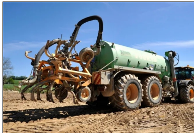
L'arroseuse à enfouissement garantit une teneur en eau optimale.