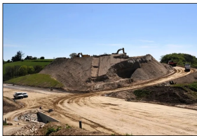
Les matériaux sont repris sur le stock à l'aide d'une pelle sur chenilles et de tombereaux articulés, puis mis en œuvre sur 40 cm par des bulis assistés par GPS.