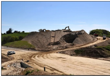
Les matériaux sont repris sur le stock à l'aide d'une pelle sur chenilles et de tombereaux articulés, puis mis en œuvre sur 40 cm par des bulls assistés par GPS.