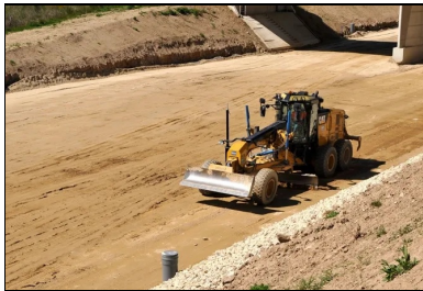
Réglage à la niveleuse pour obtenir un profil en long très régulier.

Cette opération a été suivie du traitement proprement dit, réalisé en deux étapes :