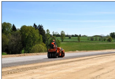
Protection de la couche de forme avec un enduit GLG.