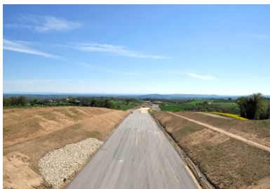
Vue d'ensemble d'un tronçon du chantier du contournement de Baraqueville.

L'un des derniers tronçons de la mise à 2 x 2 voies de la RN88, entre Baraqueville et La Mothe (aussi appelé « déviation de Baraqueville »), était attendu de pied ferme... Il est entré en chantier en 2019, pour une mise en service prévue au printemps 2022. Les nombreux mouvements des terres requis pour réaliser le profil en long de cette nouvelle voie ont conduit à choisir le traitement au liant hydraulique routier (LHR) : le but en était d'optimiser l'utilisation des matériaux présents sur place et de limiter l'impact écologique sur le territoire. En effet, le contexte environnemental sensible a nécessité des mesures importantes pour la conservation des espèces.