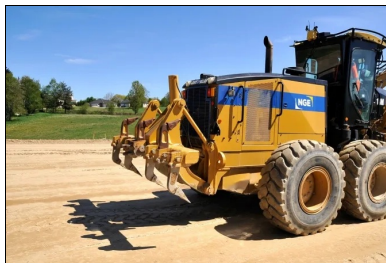
Avant épandage du LHR, le matériau est scarifié.

Le chantier s'est poursuivi avec les travaux de l'arase. Après la scarification, le LHR Rolac Optimum de Sète a été épandu et le malaxage du matériau et du LHR, sur une épaisseur de 35 cm, a commencé. Les deux natures de sols ont imposé deux dosages différents : 2 % au nord du projet (faciès gneissique) et 3 % sur le tiers sud (faciès schisteux). Un réglage avec une niveleuse équipée d'un GPS puis un compactage à l'aide d'un compacteur V5 ont été ensuite effectués. « Lors du compactage, notamment en fin d'atelier, nous avons dû redoubler de vigilance, car le schiste est un matériau qui a tendance à feuilletter », souligne Quentin Goaper. L'objectif final était d'atteindre AR2.