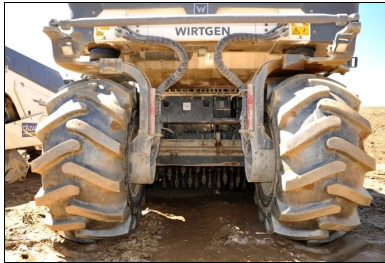
Un malaxeur Wirtgen WR 240i avec injection d'eau dans la cloche a permis le malaxage du matériau et du LHR.