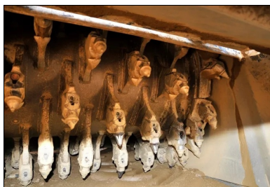
Un malaxeur Wirtgen WR 240i avec injection d'eau dans la cloche a permis le malaxage du matériau et du LHR.