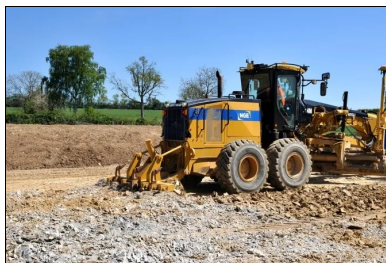
Avant épandage du LHR, le matériau est scarifié.