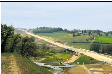
Déviation de Gimont : une couche de forme traitée au LHR