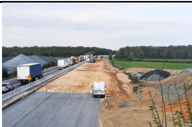
Traitement des sols pour les travaux de terrassement de l'A79, entre Toulon-sur-Allier et Digoin