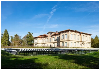
L'extension forme un socle semi-enterré qui met en valeur le château Lafon.

Dans un magnifique espace boisé, la mise en valeur d'un patrimoine existant par l'adjonction d'une extension semi-enterrée aussi moderne que discrète.