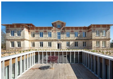
Organisée autour d'un large patio, l'extension bénéficie d'un bel apport de lumière naturelle, en toute discrétion.

Installé dans le centre du bourg de Gradignan, le Repos maternel accueille depuis des dizaines d'années des femmes enceintes et des mères isolées majeures, avec un ou plusieurs enfants à charge et en rupture avec leur milieu familial. L'institution, gérée par le CCAS de Bordeaux, profite d'un cadre privilégié, particulièrement bien adapté au besoin de calme et de protection de ces femmes. Située dans un environnement boisé et classé EBC (espace boisé classé), elle occupe notamment le château Lafon datant de 1920 et quelques bâtiments annexes répartis dans le parc. Pour conserver une qualité optimale d'accueil et d'accompagnement, l'institution s'est engagée dans un programme de modernisation et d'extension des surfaces disponibles.