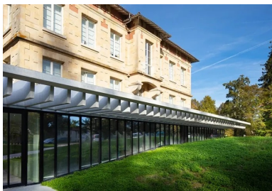
Posées en porte-à-faux, les lamelles de béton de la corolle périphérique protègent la façade vitrée des rayons solaires.