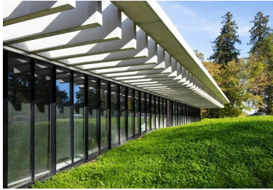
Les modelés de terrain permettent aux locaux de bénéficier de lumière naturelle en préservant l'intimité des occupants.

Ces différents éléments en béton, non porteurs, agrémentent l'extension d'une modénature résolument contemporaine, élégante et discrète qui dialogue parfaitement avec la typologie architecturale du château – une passerelle réussie entre passé et présent. A l'instar de la corolle périphérique, tous les ouvrages en béton ont été coulés en place. Si la structure porteuse de l'extension, de type poteaux-poutres avec voiles de contreventement, ne présente aucune difficulté technique, sa partition modulaire permet d'offrir des locaux qui sont facilement modulables et transformables en fonction des besoins de l'institution, toujours évolutifs.