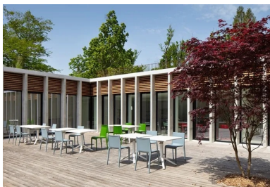
Lignes épurées et duo bois-béton créent un patio qui respire le calme et la sérénité.

Côté gestion des performances énergétiques, l'extension est conforme à la RT 2012 et le château à la RT rénovation élément par élément. Faire le choix d'une extension semi-enterrée répondait parfaitement à la volonté de discrétion du projet tout en présentant un autre avantage aussi intéressant. Elle profite ainsi de l'inertie du sol et de la toiture intensément végétalisée pour diminuer les déperditions thermiques. Cette stratégie passive apporte une grande inertie – à laquelle participe le béton –, renforcée par la mise en œuvre d'une isolation par l'extérieur qui permet de traiter la majorité des ponts thermiques. Le confort visuel n'est pas en reste avec une optimisation de l'éclairage naturel et une prédominance des surfaces vitrées. En plus des éléments d'architecture en béton faisant office de brise-soleil, des protections solaires mobiles équipent tous les locaux à occupation prolongée qui permettent de limiter les surchauffes en été et de profiter des apports gratuits d'énergie solaire en hiver. Finalement, ce projet global de rénovation et d'extension a réussi à prendre en compte les besoins spécifiques des utilisateurs tout en mettant en valeur le patrimoine existant servi par une architecture épurée et atemporelle, justement implantée et dimensionnée.