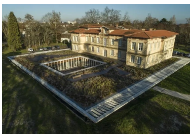
Avec sa toiture végétalisée, l'extension semi-enterrée se fond dans le parc paysager.

Conscients de l'image positive véhiculée par le « château » et de sa représentation dans l'imaginaire collectif, les architectes chargés de la rénovation et de l'extension de l'établissement ont pris le parti de la discrétion et de l'effacement pour mettre l'accent sur la valorisation de l'existant et son aspect patrimonial. Ils ont minimisé l'impact sur le parc en conservant le plus grand nombre d'arbres. Pour préserver l'intégrité architecturale du château, ils ont démolé les édifices accolés au fil du temps. Débarrassé de ces éléments parasites, le bâtiment retrouve sa position d'élément dominant.