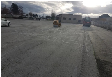
Compactage du BCR à l'aide de deux compacteurs vibrants VT2 et PV2.