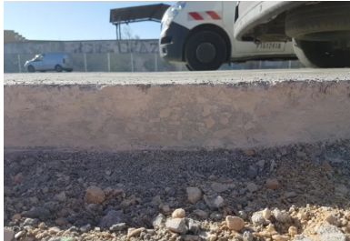
Pour la reprise de bétonnage, le joint de construction est scié proprement sur toute l'épaisseur de la couche de BCR puis humidifié. On voit bien la qualité de compactage (homogénéité et compacité) obtenue sur toute la hauteur de la couche.