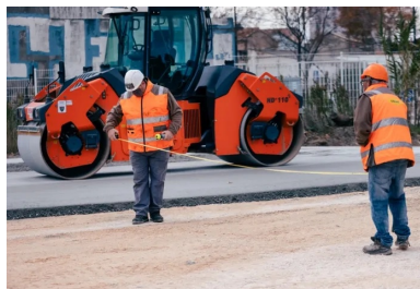
Pendant que la première couche de la première bande de BCR est compactée par un VT2, l'entreprise effectue les mesures pour positionner une nouvelle bande en respectant le plan de bétonnage en peigne.