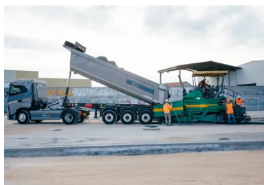
Un camion-benne, bâché durant le transport du BCR, déverse le matériau dans le finisseur. Celui-ci répand, nivelle et compacte le BCR.

Le BCR est ensuite acheminé depuis la centrale jusqu'au chantier, par camions à semi-benne. « Comme le BCR est très sensible aux variations de la teneur en eau, les camions sont équipés de bâches pour réduire l'évaporation de l'eau du matériau sous l'effet des conditions climatiques », ajoute Olivier Piselli.