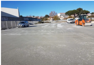
Le BCR acquiert rapidement une stabilité structurelle autorisant le stationnement des véhicules légers