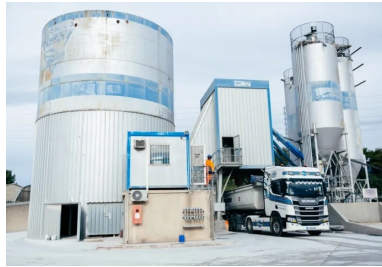
Centrale Béton VICAT où le BCR a été étudié pour optimiser sa formulation et fabriqué