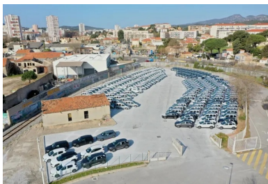
Vue aérienne de la plate-forme de stockage des véhicules en transit sur le Port de Brégaillon.

Vidéos, Guides techniques, organisation de Journées techniques, découvrez les outils mis à votre disposition sur : www.infociments.fr/routes/