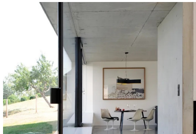
Vue sur la salle à manger depuis le salon.

La structure et l'enveloppe de la maison sont réalisées en béton gris brut. L'enchaînement des parois verticales et horizontales en béton façonne le volume de la maison et compose le rythme des opacités et des transparences.