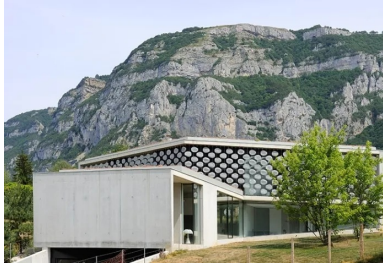
Le volume en étoile à trois branches de la maison s'inscrit dans le paysage dominé par les parois du Salève.

L'architecte Pierre Minassian a conçu ici une maison contemporaine atypique, aux lignes épurées, qui s'inscrit en toute discrétion dans le paysage.