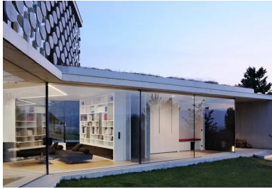
De généreuses baies vitrées ouvrent la maison sur les jardins et les vues lointaines.

La maison sous la falaise se situe en Haute-Savoie, dans un site exceptionnel. Le paysage est dominé par les parois abruptes et saillantes du Salève, tandis qu'en contrebas du versant nord de la montagne, les vues lointaines portent le regard jusqu'au lac Léman et à Genève. Ce projet est le fruit d'une étroite collaboration entre l'architecte Pierre Minassian et les futurs habitants. Prévue, lors des premières esquisses, pour une personne célibataire, la maison abrite aujourd'hui un couple et leur jeune enfant.