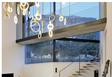
Une passerelle suspendue, qui traverse l'espace double hauteur du salon, relie la chambre parentale au palier d'étage.

À l'étage, un moucharabieh contemporain, composé de pièces en béton fibré à ultra hautes performances ( BFUP ), protège l'intimité des espaces privés, réduit l'impact solaire sur les grands vitrages et donne de l'unité aux façades.