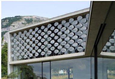
À l'étage, un moucharabieh contemporain, composé de pièces en béton fibré à ultra hautes performances (BFUP), protège l'intimité des espaces privés et réduit l'impact solaire sur les grands vitrages.

« Le propriétaire connaissait bien mon travail », explique l'architecte. « Il voulait avoir une maison à l'architecture contemporaine, comme celles que j'avais déjà réalisées. Dans les maisons que je conçois, il existe une grande fluidité spatiale à l'intérieur et les différents espaces de vie sont ouverts les uns sur les autres. À l'inverse, mon client souhaitait qu'ils soient clairement séparés, voire cloisonnés comme dans une maison traditionnelle. Souvent dans nos échanges, il me citait l'une ou l'autre de mes maisons. Je me voyais dans l'obligation de lui dire que ce que j'avais conçu, dans ces projets, était à l'opposé de ce qu'il désirait en termes de séparation et de cloisonnement strict des différentes parties de son programme. Autre point important, il voulait trouver des jardins différents, bénéficiant de diverses expositions solaires en fonction des heures de la journée. Dernier point, il tenait à profiter au maximum, de chez lui, des deux vues privilégiées, celle sur la falaise du Salève, ainsi que celle sur le lac Léman et Genève au loin.