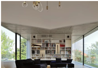
Implanté au cœur de la maison, à la croisée des trois branches de l'étoile, le salon se développe en double hauteur et offre de multiples points de vue sur le paysage.

En plan, la maison compose une étoile à trois branches. Cette figure permet la multiplication des points de vue sur le paysage spectaculaire, entraîne des jeux de lumière permanents à l'intérieur et offre une variété d'espaces et de jardins dont les occupants profitent selon l'heure de la journée.