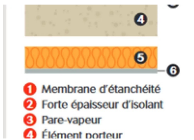
TT- Isolation en sous-face *2/3 -1/3* Fig.3b