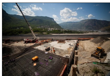
La construction de la tranchée couverte nécessite le déplacement puis le rétablissement de la RD1006 et de l'A43 (au fond).

C'est l'une des plus grandes infrastructures en cours de construction dans le monde. La future liaison ferroviaire de 270 km entre Lyon et Turin est un projet au long cours dont la section transfrontalière comprend le tunnel bitube de base du Mont-Cenis, d'une longueur record de 57,5 km (voir encadré 1). Pour anticiper le percement de cet ouvrage souterrain majeur, son maître d'ouvrage binational Telt (Tunnel Eurpalin Lyon Turin) aménage actuellement les sections d'approche dans la vallée de la Maurienne. Sur le site de Saint-Jean-de-Maurienne en Savoie, plusieurs lots de travaux sont ainsi en construction : des digues en rive gauche de la rivière de l'Arc, des ouvrages de génie civil en gare de Saint-Jean-de-Maurienne et la tranchée couverte de Saint-Julien-Montdenis. Cette dernière, qui raccordera l'entrée du tunnel de base côté français, permettra le passage des voies ferrées de la future ligne sous l'autoroute A43 et la route départementale 1006.