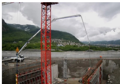
Le déploiement du bras de distribution articulé de la pompe à béton permet d'atteindre tous les points de coulage du chantier, même les plus difficilement accessibles, comme ici lors de la construction d'un voile latéral de l'ouvrage cadre.

Pour arriver à rétablir l'autoroute à temps, le groupement d'entreprises a mis les bouchées doubles, en augmentant le nombre de jeux de banches, en renforçant les équipes de chantier et en modifiant les méthodes de chantier. « Initialement, nous avions prévu d'utiliser un outil coffrant pour couler l'ouvrage demi-plot par demi-plot, illustre Olivier Viret. Pour combler le retard, nous avons étayé et coulé les plots 2 et 3 en une seule étape. » Finalement, le projet a pu être livré en temps et en heure, grâce au dialogue constructif et bienveillant qui s'est noué entre le groupement d'entreprises, le groupement de maîtrise d'œuvre, le maître d'ouvrage et la SFTRF - tous unis dans un même objectif face à la crise sanitaire : livrer le projet en temps voulu.