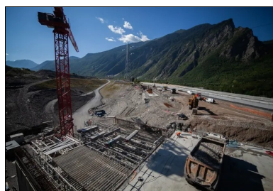
Pour pouvoir respecter le phasage de déplacement des chaussées, la tranchée couverte est construite en 4 phases.