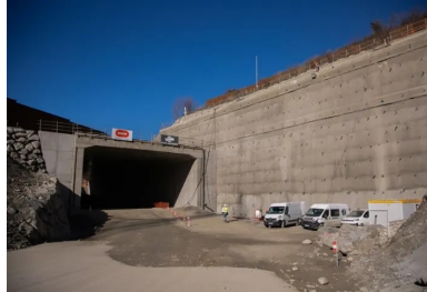
La tranchée couverte dégage une section libre de 18 m de large et 9 m de haut, dimensionnée pour accueillir deux voies ferrées à grande vitesse et tous les équipements du tunnel.

Une fois la fouille constituée, la réalisation de l'ouvrage cadre a pu démarrer. Long de 90 m, large de 20 m, celui-ci est entièrement constitué de béton armé résistant au feu (voir encadré 2). La tranchée couverte dégage une section libre de près de 18 m de large et de 9 m de haut, dimensionnée pour accueillir les deux voies ferrées à grande vitesse et tous les équipements du tunnel. « La large portée de la tranchée couverte, que nous ne pouvions pas doter d'appui intermédiaire, nous a conduits à concevoir des éléments structuraux assez massifs et fortement ferrillés », poursuit Laurent Levasseur. L'épaisseur des traverses supérieures, qui soutiennent l'autoroute et la RD, atteint ainsi 1,2 m, celle du radier et les voiles latéraux 1 m.