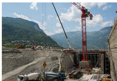
Les 9 000 m 3 des bétons de structure sont coulés en place. Le chantier dispose d'une centrale à béton principale située à Saint-Jean-de-Maurienne et d'une centrale de secours à Saint-Julien-Montdenis.

« Comme souvent lorsqu'un ouvrage est réalisé sous des infrastructures existantes, la construction de la tranchée couverte devait d'abord s'adapter à un phasage général complexe », expose Frédéric Fabre, responsable du projet pour Telt. Le trafic sur l'A43 et la RD1006 devait en effet être maintenu continuellement durant toute la durée des travaux. La première opération du chantier a donc consisté à déplacer la RD1006 et l'A43 à quelques dizaines de mètres du site du chantier, sur une plateforme temporaire le long de la rivière de l'Arc. Une fois cette lourde étape réalisée, les équipes travaux ont alors pu s'emparer du site du chantier pour réaliser la fouille à l'intérieur de laquelle serait bâtie la tranchée couverte. 250 000 m 3 de déblais ont ainsi été extraits de la butte jouxtant le village de Villard-Clément.