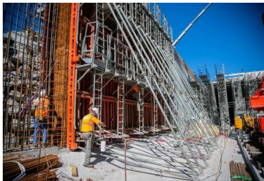
Préparation des banches métalliques nécessaires au coulage d'une voile latérale.