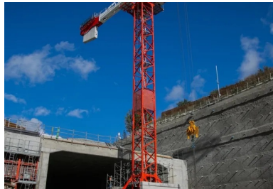
Pour résister à un éventuel incendie dans le tunnel, le béton armé de la tranchée couverte ne dispose pas de protection au feu rapportée, mais d'une formulation spécifique : celle-ci intègre des fibres synthétiques en polypropylène qui, en fondant sous l'effet de la chaleur, libèrent des canaux connectés à l'intérieur du béton laissant la vapeur d'eau s'échapper, ce qui permet de maîtriser les risques de fissuration et d'écaillage du béton.