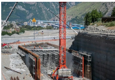
Les traverses supérieures de la tranchée couverte sont coulées en place à partir de tours d'étalement.