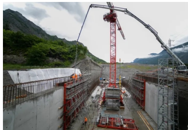
Coulage en cours de l'un des voiles latéraux de la tranchée couverte, dont l'épaisseur atteint 1 m.

Autre contrainte pour les entreprises : quasiment toutes les phases de construction se situaient sur le chemin critique du chantier, le planning étant contraint par la nécessité de déplacer puis de rétablir l'autoroute avant la période de viabilité hivernale. « Ce compte à rebours déjà millimétré a été singulièrement resserré par les conséquences de la crise sanitaire liée à l'épidémie de Covid-19 », ajoute Olivier Viret. Le confinement de mars 2020 a ainsi entraîné l'arrêt du chantier pendant deux mois. « Ce retard était critique pour le chantier car nous devions impérativement rétablir l'A43 dans son tracé d'origine et la remettre au concessionnaire, la SFTRF (Société française du tunnel routier de Fréjus), avant la période de viabilité hivernale », se rappelle Frédéric Fabre.