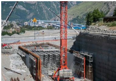
Les traverses supérieures de la tranchée couverte sont coulées en place à partir de tours d'étalement.