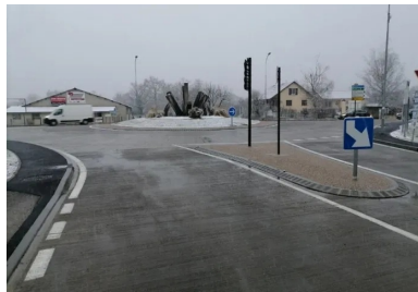
Le chantier du nouveau giratoire de Montalieu-Vercieu a pris fin le 16 novembre 2020, soit seulement deux semaines après la fin de la mise en œuvre du béton.

Vidéos, Guides techniques, organisation de Journées techniques, découvrez les outils mis à votre disposition sur : www.infociments.fr/routes/