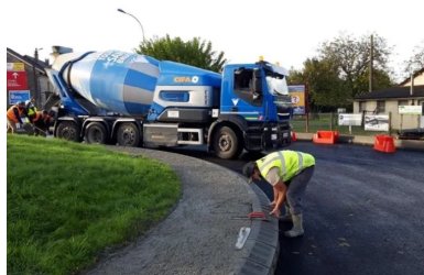
Le giratoire a été doté de nouvelles bordures dont les fondations ont été renforcées pour éviter les retournements.