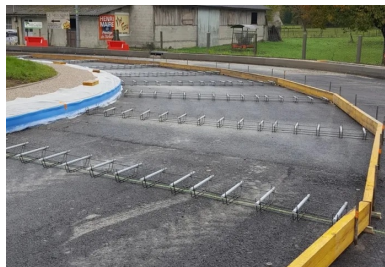
Après l'homogénéisation de la fondation en GB, l'entreprise a procédé à l'installation des coffrages et des paniers de goujons, conformément au plan de calepinage.

Les fers de liaison et les goujons métalliques (quelque 2 147 goujons au total, d'une longueur de 0,45 m et d'un diamètre de 25 mm, avec un revêtement antiadhérent de 0,5 mm, espacés tous les 30 cm) ont été disposés sur des supports et fixés sur la grave-bitume, à mi-hauteur des dalles et à cheval sur les joints transversaux, selon le calepinage prévu.