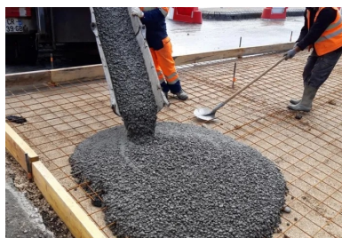
Réalisation des dalles de transition.