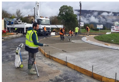
La protection du béton a été assurée par un produit de cure qui a été pulvérisé immédiatement après le traitement de surface.

Un produit de cure a été immédiatement pulvérisé sur le béton , après sa mise en œuvre, pour éviter sa dessiccation.