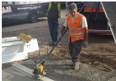
Le béton pompé a été réparti et étalé manuellement, puis vibré à la règle vibrante pour assurer son bon serrage.

planéité ont été parfaitement assurés, l'écoulement des eaux s'effectuant sur les exutoires. »