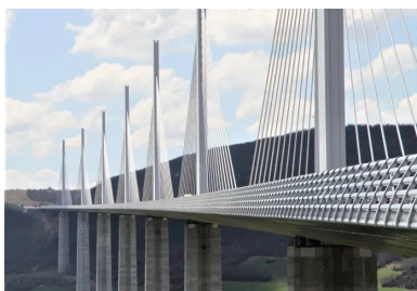
Viaduc de Millau, France