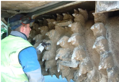
Détail du rotor du malaxeur

Durant le mélange et si nécessaire, de l'eau peut être introduite suivant un dosage précis. De plus, plutôt que d'épandre le liant sous forme de poudre, comme décrit plus haut, une pâte liquide (coulis) formée d'eau et de ciment peut être injectée directement dans la chambre de malaxage, évitant ainsi la production de poussière. En France, des entreprises ont développé des ateliers de retraitement (ARC ou équivalent). ARC est l'acronyme d'« atelier de reconditionnement de chaussées ». Il s'agit en effet d'un atelier intégrant toutes les opérations et pouvant les exécuter en un passage. Un des grands avantages de cette machine est la présence de deux rotors : le malaxage se fait aussi bien transversalement que verticalement, ce qui donne un produit fini particulièrement homogène.