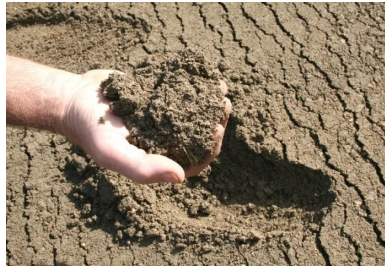
Aspect matériau après malaxage

L'objectif de cette opération est de mélanger intimement in situ et à froid les matériaux obtenus par fragmentation de l'ancienne chaussée. Ceux-ci sont éventuellement modifiés par l'ajout d'un correcteur granulométrique et humidifiés, avec le liant épandu en surface, afin d'obtenir, après prise et durcissement , un mélange homogène présentant des caractéristiques mécaniques élevées. Dans le cas où le matériau est à forte teneur en argile, le traitement au liant hydraulique est précédé par un traitement à la chaux . L'opération de traitement est conduite à l'aide d'un matériel spécifique : le malaxeur-pulvérisateur .