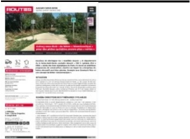
Cet article est extrait de Routes Info n°8