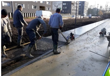
Le tirage du béton au rouleau Striker. Il n'a pas été vibré pour ne pas faire descendre le granulats, qui doit rester en surface pour le bon aspect visuel de la finition piquée.