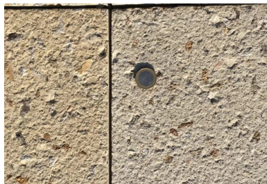
Les joints de retrait-flexion ont été réalisés le lendemain du coulage par sciage sur un tiers de l'épaisseur du béton, tous les 3 ml (piste cyclable) et tous les 1,5ml (voie piétonne).

Des joints de retrait-flexion ont été réalisés le lendemain du coulage par sciage sur un tiers de l'épaisseur du béton, tous les 3 ml (piste cyclable) et 1,5 ml (voie piétonne). Pour ne pas épauprer les bords, ils ont été remplis avec un coulis à prise accélérée avant la réalisation de la finition piquée. Ils ont été ensuite rouverts par sciage.