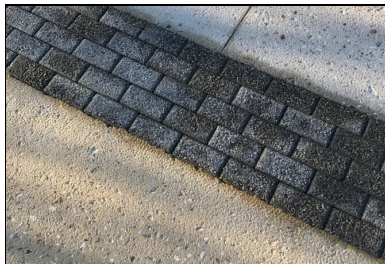
Une bande structurante en pavé.