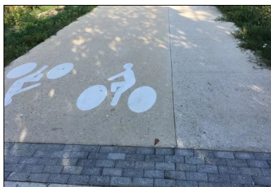
La piste cyclable et la bande piétonne ont été rapidement ouvertes à la circulation.