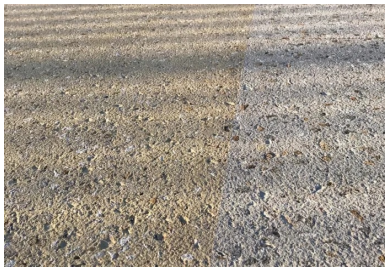
Les deux finitions de béton : ocre clair à gauche et gris clair à droite.