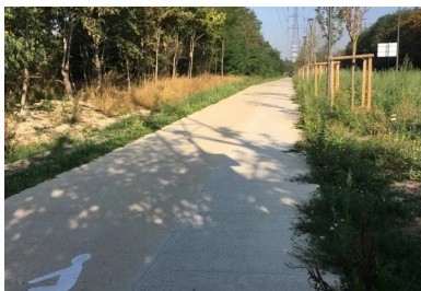
L'ouvrage a été réalisé entre deux espaces verts, à proximité immédiate de végétaux réimplantés dans une terre naturelle.

Vidéos, Guides techniques, organisation de Journées techniques, découvrez les outils mis à votre disposition sur : www.infociments.fr/routes/