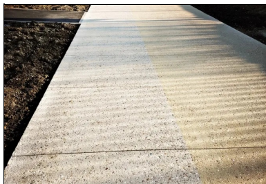
Le chantier, très linéaire a nécessité la pose de 1 800 ml de coffrage (3 x 600 ml).