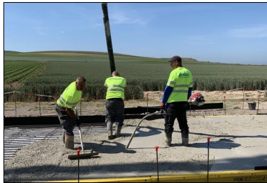
Bétonnage : alimentation du béton à la pompe, réglage au rateau, suivi du serrage du béton à l'aiguille vibrante.

Consultez le mémo technique sur le BAC en annexe.