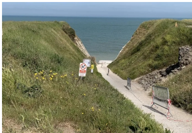
L'aménagement est destiné à permettre aux visiteurs d'accéder facilement à la plage située aux pieds des falaises.