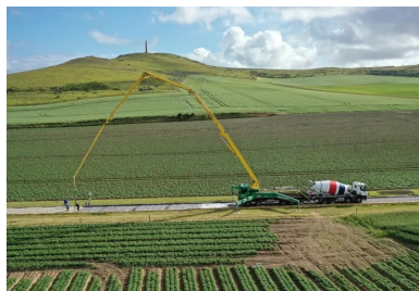
Coulage du béton sur la rue de la Mer avec vue sur le cap Blanc-Nez et l'obélisque à la mémoire de la Dover Patrol. Le débattement de la pompe limite le coulage à des sections de 60 mètres par jour (environ 270 m 2 , soit la capacité de six ou sept toupies).

Parfaitement intégrée à son environnement , esthétiquement qualitative, pratique, polyvalente et prévue pour défier le temps, la nouvelle rue de la Mer d'Escalles a été achevée pour l'ouverture de la saison estivale de 2020. Les vacanciers du Grand Site des Deux Caps sauront l'apprécier. Vu cette première, nul doute que ce chantier en préfigure d'autres dans le département du Pas-de-Calais !