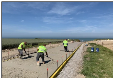
L'épandage du béton s'effectue à l'aide de différents outils : rateau, épandeur ou lisseuse.