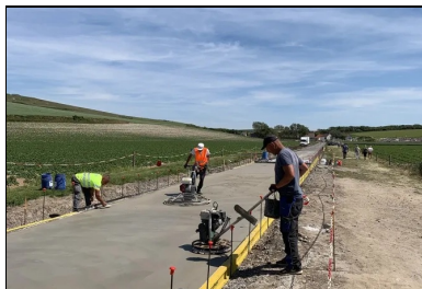
Deux lisseuses mécanisées (hélicoptères) achèvent le lissage fin.