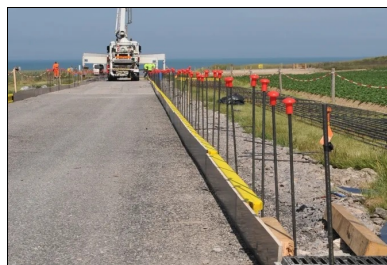
Préparation de la plate-forme support : purge, reprofilage, travaux d'assainissement, compactage et enduit superficiel.

Voiries et aménagements urbains en béton : principes fondamentaux d'aide à la conception des projets. Les bétons utilisés