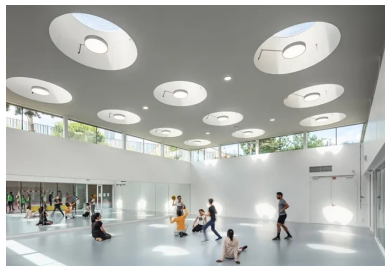
Vue sur la salle de gymnastique caractérisée par son ambiance blanche et lumineuse.

L'architecture de ce gymnase exprime la présence de l'équipement tout en s'inscrivant avec un impact minimum dans le site. « Elle porte une attention bienveillante aux habitations riveraines dont les vues et l'ensoleillement sont préservés, et offre en couverture un sanctuaire de biodiversité en ville. Sur une épaisse couche de terre, euphorbes, graminées et végétations spontanées composent un paysage inattendu », précise l'architecte Djamel Kara.