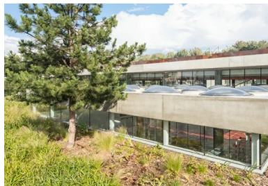
Sur la rue de Bellevue, le gymnase participe pleinement à l'aménagement paysager et semble posé sur un tapis végétal offert à la vue des riverains et des passants.

L'idée du projet est née lors de la première visite sur le site. Les vestiges du bâtiment incendié avaient été déblayés et le terrain entièrement nettoyé. Ainsi, depuis la cour du collège et le plateau sportif, s'offrait alors au regard une large vue dégagée vers les lointains et sur le tissu pavillonnaire du bas de la ville de Colombes. En revanche, les fondations de l'ancien gymnase n'avaient pas été démolies du fait de l'existence d'une procédure contentieuse en cours à l'époque. Le cahier des charges du concours précisait, que ces fondations seraient à démolir lors du chantier de la nouvelle opération, ce qui nécessitait d'excaver le terrain d'emprise. Les concepteurs ont utilisé cette contrainte pour définir un projet présentant une architecture partiellement enterrée. Ils ont proposé de creuser plus profondément, afin de réaliser un bâtiment enfoui aux 2/3 permettant ainsi de conserver depuis le collège et les cours des vues dégagées sur les horizons lointains. Le projet s'inscrit dans la logique d'étagement déjà en œuvre dans les espaces récréatifs du collège Marguerite Duras et permet une transition douce entre l'équipement scolaire et le quartier.