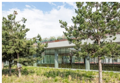
Sur la rue de Bellevue, le gymnase participe pleinement à l'aménagement paysager et semble posé sur un tapis végétal offert à la vue des riverains et des passants.