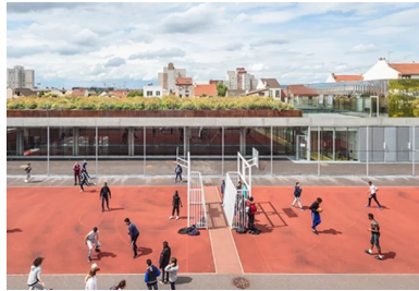
La dalle de toiture en béton du gymnase, soulevée au-dessus du sol, accueille un jardin.

La dalle de toiture de ce gymnase partiellement enterré accueille un jardin sur la quasi-totalité de sa surface, offert à la vue des riverains et des passants.