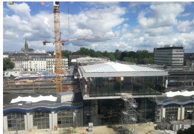
La gare-pont s'apparente à une grande rue qui franchit les voies ferrées pour relier le quartier historique au nouveau quartier d'affaires.

« Il présente d'indéniables aménités en termes d'usage, de surfaces supplémentaires, de rationalité structurelle, de logique économique et de maîtrise financière. » En effet, cette solution offre quelque 4 000 m 2 supplémentaires, dont 2 200 m 2 d'espaces de transit et 1 500 m 2 de commerces. Mieux qu'un simple trait d'union, l'ouvrage s'apparente à une grande rue perchée à 10 m du sol. Cet espace, éminemment spa-cieux et lumineux, offre des vues panoramiques sur le canal Saint-Félix, la ville et le paysage ferroviaire. Mariant les flux voyageurs, l'activité commerciale et la vie urbaine, il rappelle la salle des pas perdus des grandes gares classiques. À cela s'ajoute une gestion évidente des flux : « Des porte-à-faux en béton signalent les entrées de la gare », précise Catherine Malleret. « À l'intérieur, les circulations verticales sont implantées frontalement et immédiatement visibles. Le maître d'ouvrage a apprécié cette disposition qui facilite les mouvements. »