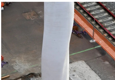
Afin de se singulariser, chaque « tronc » varie de 20° son angle d'orientation.

Les neuf piles de deux « troncs » qui portent la mezzanine sont implantées longitudinalement avec des travées comprises entre 14 à 22 m. Les éléments métalliques du coffrage se divisent en 3 pièces pour faciliter le décoffrage . Ils ont été modélisés en 3D et revêtus d'une résine polymère pour garantir la finition lisse du béton blanc . La pompe à béton destinée à alimenter les coffrages est installée à l'extérieur de la gare. Pour ne pas enjambrer les voies et risquer de couper l'alimentation électrique des caténaires, 27 m 3 de béton blanc autoplaçant ont été injectés à partir du pied de chaque pile grâce à un tuyau d'alimentation positionné dans un passage souterrain existant. « Le maintien de l'exploitation ferroviaire nous a imposé de coffrer et de ferrailer la nuit pour couler le béton dans la journée », précise Grégoire Bougie. « Nous totalisons plus de 500 nuits travaillées. » Les équipes de LafargeHolcim ont travaillé plusieurs mois pour mettre au point la formule du béton blanc autoplaçant avec un impératif : faire en sorte que le béton reste « liquide » pendant trois heures afin d'éviter tout risque d'obstruction des tuyaux pendant le coulage.