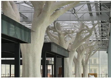
À 10 m du sol, la couverture de la mezzanine est portée par une allée d'arbres en béton projeté.

La nouvelle gare de Nantes franchit le faisceau ferroviaire au moyen d'une rue aérienne bordée d'arbres en béton qui relie le centre historique au quartier d'affaires EuroNantes au sud.