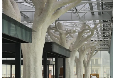
À 10 m du sol, la couverture de la mezzanine est portée par une allée d'arbres en béton projeté.

La nouvelle gare de Nantes franchit le faisceau ferroviaire au moyen d'une rue aérienne bordée d'arbres en béton qui relie le centre historique au quartier d'affaires EuroNantes au sud.