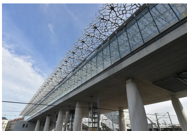
Les baies vitrées sont protégées des apports solaires par des ombrières en BFUP.

Inspirée de formes arborescentes, la structure porteuse en béton s'élève sur deux niveaux. La première structure, porte le tablier de la mezzanine à 10 m de haut, il s'agit de 18 piles géantes en béton dont la forme organique s'apparente à des troncs enracinés par un réseau de 360 micropieux, dont certains descendent à 25 m de profondeur. Pour la deuxième, au niveau de la mezzanine, les troncs se transforment en une allée d'arbres en béton dont les branches déploient une charpente triangulée qui porte la couverture. En guise de canopée, des ombrières se déploient en porte-à-faux pour protéger du soleil les façades vitrées. Les « troncs » sont en béton blanc, le tablier en béton armé, les « arbres » en métal habillé de béton projeté et les fines membrures de l'ombrière en Béton Fibré à Ultra Hautes Performances (BFUP), matériau d'élection de Rudy Ricciotti. « Le béton est beaucoup plus performant que l'acier ou l'alu », insiste le célèbre architecte. « C'est un matériau à empreinte écologique faible, n'en déplaie aux écologistes obtus. Et puis, ce n'est pas délocalisable : ces bâtiments donnent du travail à beaucoup d'ouvriers sur place. Réduire le besoin de main d'œuvre, c'est aussi réduire l'énergie architecturale. »