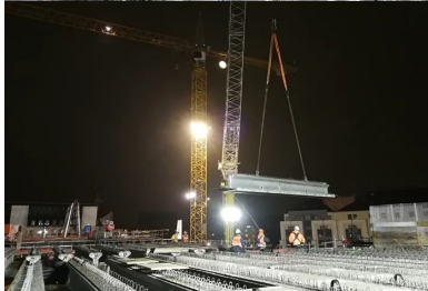
Le tablier est constitué de poutres préfabriquées en béton en forme de T inversé.