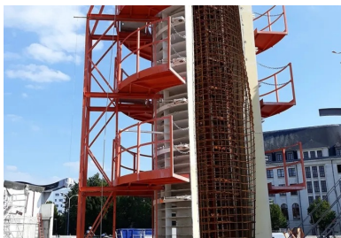
Les piles en béton blanc autoplaçant coulé en place portent la mezzanine.