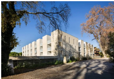
une architecture puissante, travaillée en creux, qui s'impose sous le soleil méditerranéen.