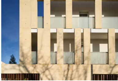
Les façades en béton matricié participent de la structure tout en isolant les loggias aménagées dans le volume général des immeubles.