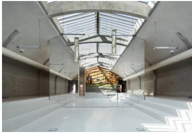
S'élevant dans la hauteur de l'ancienne piscine, le grand mur en inox dilate l'espace.