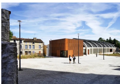
Le parvis de la médiathèque. Le cube du volume d'accueil en extension du bâtiment d'origine.

Par sa structure en béton armé suspendue avec sa voûte mince, le bâtiment d'origine est représentatif de l'architecture industrielle du début du XXe siècle. Il appartient à l'histoire des grandes coques paraboliques utilisées pour les hangars et témoigne d'un savoir-faire technique qui s'est développé à l'époque. Sa rénovation et sa transformation pour de nouveaux usages offrent l'occasion de revaloriser ce patrimoine existant en lui donnant une nouvelle vie. Loin d'être extravagant, l'investissement consenti pour réaliser cette métamorphose, soutenue par la région comme le département, s'inscrit dans une démarche respectueuse de l'environnement humain et urbain. Ainsi, la nouvelle médiathèque est l'occasion pour les habitants de s'approprier en douceur un équipement qui, jusque-là, leur échappait. Elle pourrait aussi symboliser un début de revitalisation de la ville et des communes alentour.