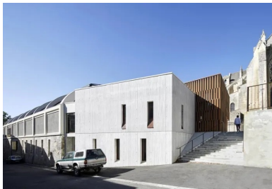
Depuis la rue basse, le nouveau volume en béton blanc brut qui abrite les bureaux de la médiathèque.