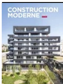
Cet article est extrait de Construction Moderne n°161

Maître d'ouvrage : CCI Nice-Côte d'Azur ; ville de Cannes ; conseil départemental des Alpes-Maritimes ; communauté de communes – AMO maîtrise d'œuvre urbaine, architecte et paysagiste : Jean-Louis Durochat (Archipay) – Maîtrise d'œuvre : Egis – Entreprises : groupement associant TP Spada, mandataire ; Jean Negri & Fils, Razel Bec et Campenon Bernard TP Côte d'Azur.