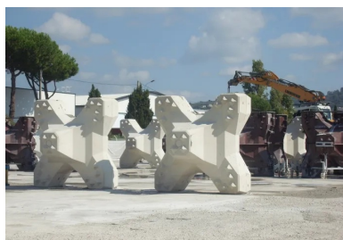
Les ACCROPODE™ (TM) II sont des blocs en béton coulés en une fois dans des moules spécifiques. Ils sont dotés de protubérances tronconiques qui optimisent l'accrochage des éléments entre eux et permettent d'augmenter la pente d'une digue à talus.

Le confortement des digues est réalisé par un groupement d'entreprises qui mettent en commun leur expertise et leurs moyens pour assurer les travaux maritimes, le génie civil, l'insertion des réseaux et la préfabrication des éléments en béton (ACCROPODE™ II et mur chasse-mer). Les travaux se sont déroulés d'octobre 2018 à avril 2019 par voie terrestre, le parking Laubeuf servant de plateforme de chantier. L'exiguïté à l'extrémité de la digue n'a pas simplifié les conditions de réalisation et a nécessité la construction d'ouvrages temporaires. La cinématique fut structurée en trois étapes, à commencer par la dépose d'une sous-couche d'enrochements (200 cubes en béton) et d'enrochements naturels (10 000 m 3 ) en pied de l'ouvrage. La deuxième étape fut de reconfigurer le profil de la digue avec la mise en place de 1 179 ACCROPODE™ II dont la forme, le volume (4 m 3 ) et le poids (9,6 t) rendent la carapace particulièrement résistante aux assauts de la mer. Enfin, la première phase s'est terminée avec la réalisation d'une partie du mur chasse-mer.