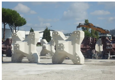
Les ACCROPODE (TM) II sont des blocs en béton coulés en une fois dans des moules spécifiques. Ils sont dotés de protubérances tronconiques qui optimisent l'accrochage des éléments entre eux et permettent d'augmenter la pente d'une digue à talus.

Le confortement des digues est réalisé par un groupement d'entreprises qui mettent en commun leur expertise et leurs moyens pour assurer les travaux maritimes, le génie civil, l'insertion des réseaux et la préfabrication des éléments en béton (ACCROPODE™ II et mur chasse-mer). Les travaux se sont déroulés d'octobre 2018 à avril 2019 par voie terrestre, le parking Laubeuf servant de plateforme de chantier. L'exiguïté à l'extrémité de la digue n'a pas simplifié les conditions de réalisation et a nécessité la construction d'ouvrages temporaires. La cinématique fut structurée en trois étapes, à commencer par la dépose d'une sous-couche d'enrochements (200 cubes en béton) et d'enrochements naturels (10 000 m 3 ) en pied de l'ouvrage. La deuxième étape fut de reconfigurer le profil de la digue avec la mise en place de 1 179 ACCROPODE™ II dont la forme, le volume (4 m 3 ) et le poids (9,6 t) rendent la carapace particulièrement résistante aux assauts de la mer. Enfin, la première phase s'est terminée avec la réalisation d'une partie du mur chasse-mer.