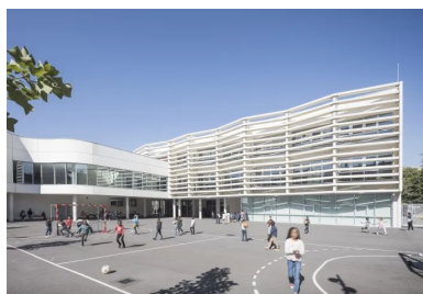
Les brise-soleil en béton blanc animent la façade sud.

Au sud, le traitement de la cour élémentaire semble plus sage, même si le volume vitré, abritant un espace de circulation entre les deux écoles, avance lui aussi en courbe. Des brise-soleil habillent la façade d'une résille de béton blanc qui crée un jeu d'ombre et de lumière comme un crayonnage sur un dessin d'enfant.