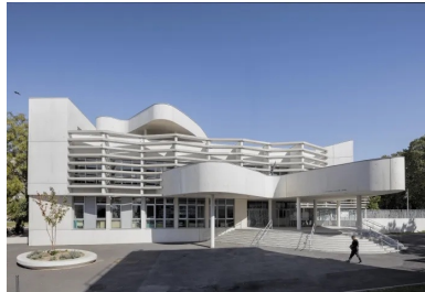
Le parvis d'entrée spectaculaire dessert les deux écoles, maternelle et élémentaire.

Jean-Pierre Lott a conçu son bâtiment au cœur d'un des îlots du quartier des Lochères. C'est dans un écrin de verdure, avec une végétation variée et de beaux et grands arbres, que s'élève le groupe scolaire. La présence de la végétation fut une donnée très importante dans la genèse du projet, car elle est un élément structurant de l'espace existant, brisant la monotonie suscitée par les barres d'immeubles qui cimentent le terrain.