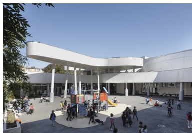
L'architecte a développé, grâce au béton, tout un univers enfantin.

Le bâtiment se répartit en deux ailes à R+2, chacune dédiée à une école, agencées en quinconce. Devant chacune d'elles se déploient les cours de récréation. Dans la partie sud-ouest, l'école maternelle occupe le rez-de-chaussée et le premier niveau (administration, salles de classe, de repos, de motricité...), au second se trouve le logement de gardien. La partie nord-est abrite l'école élémentaire sur trois niveaux. Le restaurant scolaire et la cuisine communs sont situés au nord, ce qui crée un point de jonction entre les deux établissements.