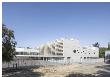
Les façades sont toutes traitées selon leur relation à l'urbain.