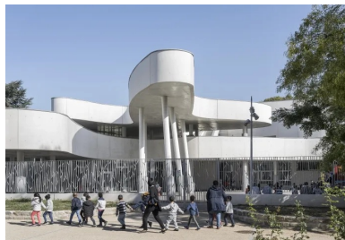
Les superpositions de niveaux engendrent une densité constructive.

Son bâtiment agit d'ailleurs comme un signal architectural, un paradigme de la contemporanéité urbaine. Et ceci d'autant plus qu'un travail sensible a été réalisé sur les accès et les rues alentour, intégrant ainsi le groupe scolaire dans son quartier. Des voies en parcours piétonnier, bordées par des murs parfois surmontés de grilles aux motifs graphiques, depuis les immeubles qui entourent l'école jusqu'à celle-ci, sont aménagées pour la plus grande sécurité des enfants. De plus, ces voies créent des liaisons entre les quartiers environnants, engendrant une fluidité de cheminement et de nouveaux liens avec la ville.