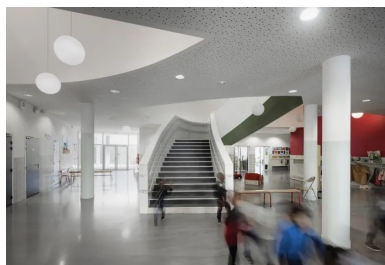
L'escalier de la maternelle est mis en scène dans un espace lui très libre

« Nous avons porté une grande attention à tous les détails de la construction, avec un soin particulier porté au calepinage , à l'alignement des baies et des joints de banches par exemple... Les faux plafonds extérieurs sont en béton pour forger une unité et insister sur la matérialité de tous les éléments du bâtiment. Aucun composant architectural n'a été négligé », nous dit Jean-Pierre Lott.