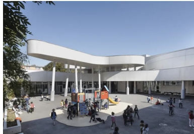
L'architecte a développé, grâce au béton, tout un univers enfantin.

Le bâtiment se répartit en deux ailes à R+2, chacune dédiée à une école, agencées en quinconce. Devant chacune d'elles se déploient les cours de récréation. Dans la partie sud-ouest, l'école maternelle occupe le rez-de-chaussée et le premier niveau (administration, salles de classe, de repos, de motricité...), au second se trouve le logement de gardien. La partie nord-est abrite l'école élémentaire sur trois niveaux. Le restaurant scolaire et la cuisine communs sont situés au nord, ce qui crée un point de jonction entre les deux établissements.