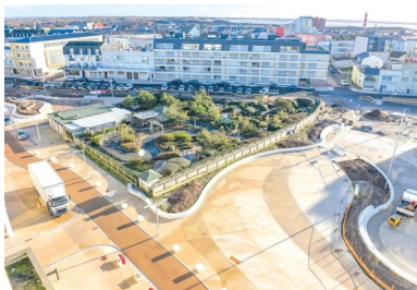
La couleur de base du béton est celle du sable de Berck. Selon le projet de Paysage 360, cette teinte se décline ensuite - du plus sombre au plus clair pour reconstituer les méandres de l'ancienne rivière.

Étape essentielle : la réalisation de la couche de forme. « Elle est constituée d'une grave traitée et recyclée d'une épaisseur de 15 cm sur toutes les plates-formes et de 25 cm pour les voiries, indique Christophe Leprêtre, le conducteur de travaux d'Eurovia. Total : 6 000 tonnes. Pour diminuer l'empreinte carbone, nous avons recyclé la plupart des matériaux sur place, avec criblage et concassage de ceux-ci sur une plate-forme à proximité du chantier. Puis, une fois la couche de forme réalisée, nous avons procédé à la vérification des portances, avant de couler le béton . »