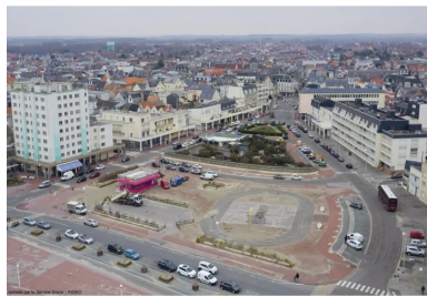
L'Entonnoir est une « patte d'oie » naturellement créée à la fin du XVII e siècle par l'assèchement d'une rivière dont on peut encore deviner le cours.