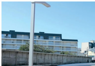
L'éclairage public a été entièrement repensé avec l'utilisation de diodes électroluminescentes (LED).