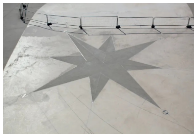
La magnifique rose des vents dont les branches forment des angles aigus, ce qui rend délicate la mise en œuvre du béton - a été réalisée avec un soin tout particulier.