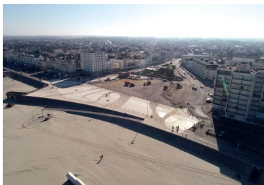
Une première phase de requalification concerne 17 000 m². Quelque 3 200 m³ de béton ont été mis en œuvre par Eurovia, soit 400 toupies de 8 m³.

« Le béton choisi est résistant aux embruns. C'est un ciment CEM III/A 42,5 N LH CE PM ( prise mer) – ES (eaux sulfatées) NF. Il est dosé à 350 kg pour obtenir une résistance de 30 MPa et satisfaire à une classe d'exposition XF 2 pour le cycle gel-dégel. L'entraîneur d'air utilisé génère des microbulles d'air dans le béton, ce qui lui permet de mieux résister au gel en évitant les contraintes dans le béton, précise Frédéric Butel, responsable des sites du secteur littoral EQIOM Bétons de la région Hauts-de-France. Ce ciment CEM III est un ciment laitier avec un indice carbone optimisé. Il a une prise plutôt lente, ce qui facilite sa mise en œuvre. » Il est produit à l'usine de Lumbres, située à une quinzaine de kilomètres à l'est de Saint-Omer, toujours dans le Pas-de-Calais (production annuelle : 750 000 t/an).