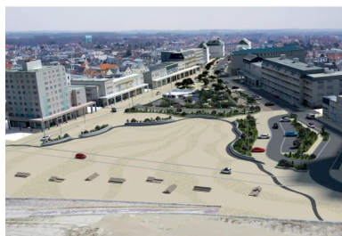
Vue d'artiste du projet.

Précaution d'entretien : il a été conseillé au maître d'ouvrage de ne pas utiliser de sels de déverglage pour ne pas altérer la teinte. Sans précaution, le sel peut engendrer des dégradations sur l'esthétique du béton, surtout s'il est coloré et même s'il a reçu une protection antitache et antisalissure, comme c'est le cas ici.