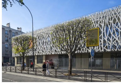
Une résille à la thématique végétale, composée d'éléments préfabriqués en béton blanc fibré à ultra hautes performances (bfup), habille et protège les façades sur rue.

La reconstruction de l'école maternelle Éva Salmon s'inscrit dans le renouvellement urbain du quartier du Port à l'Anglais engagé par la ville de Vitry-sur-Seine. Le chantier du nouvel édifice scolaire s'est effectué en site occupé. Implantée à l'angle des rues Charles Fourier et Pasteur, face à la halle Dumeste, un ancien bâtiment industriel remarquable, l'école bénéficie d'une situation stratégique dans ce quartier qui connaît un fort développement immobilier avec les projets de la Zac du Port à l'Anglais, du « Fulton dock » du port et de la Zac de Seine Gare Vitry.