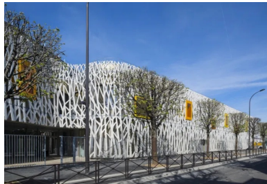
L'entrée de l'école s'organise sous l'encorbellement du 1 er étage rue Charles Fourier.

« À l'école maternelle, les enfants apprennent par le jeu à s'exprimer et découvrent que l'apprentissage est dorénavant un horizon naturel de leur vie. Le projet architectural que nous avons imaginé intègre cette dimension pédagogique particulière en proposant un cadre à la fois ludique, convivial et protecteur. La géométrie des façades, comme celle des espaces intérieurs, fait la part belle aux courbes, composant un univers doux à l'échelle de l'enfant. Une résille à la thématique végétale, composée d'éléments préfabriqués en béton blanc fibré à ultra hautes performances (bfup), habille et protège les façades donnant sur l'espace public. Elle joue également le rôle de brise-soleil pour la façade de la rue Charles Fourier orientée au sud. Cette résille est percée de baies vitrées teintées, qui font référence à l'imaginaire ludique des cabanes dans les bois. Ces ouvertures offrent des cadrages singuliers sur l'environnement qui positionnent l'enfant en observateur privilégié de la ville. »