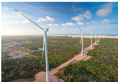
Vue générale de la ferme pilote de Trairi, au nord-est du Brésil. Les 36 éoliennes, dont les tours culminent à 119 m, développent une puissance unitaire de 2,7 MW.

C'est l'outil Eolift qui se substitue à la grue. Pour cela, une petite potence pivotante a été intégrée à chaque demi-côté de l'Eolift. Elle permet notamment de décharger directement les voussoirs en béton des camions.